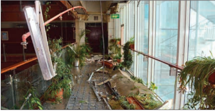
جانب من آثار انهيار السقف