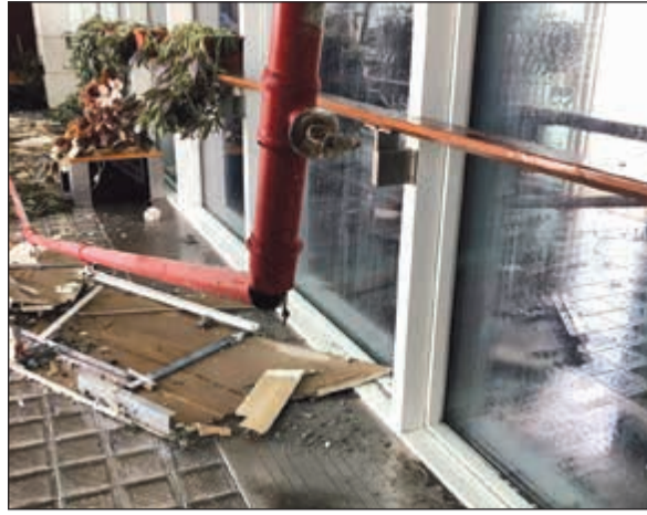
باب المياه المكسور