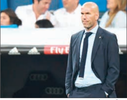
زين الدين زيدان

رد المدرب الفرنسي لريال مدريد زين الدين زيدان على كل من يقول ان فريقه خسر معركة الصراع على لقب الدوري الإسباني كونه يتخلف بفارق 7 نقاط عن غريمه برشلونة بعد 5 مراحل فقط، بالقول ان فريقه سيعود الى دائرة الصراع وسيكون في خضمها قبل نهاية العام الحالي. وتوجه زيدان الى المتكلمين بفريقه، قائلا: «إن كنتم تعتقدون ان الدوري انتهى، هنيئاً لكم! لكن الموسم مازال طويلاً جداً وستكون في قلب الصراع».