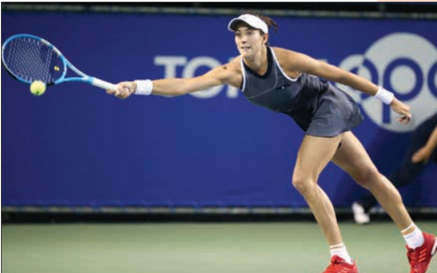
الإسبانية غاربيني موغوروسا

السابعة والتي حسمت مبارياتها الصعبة مع التشيكية كارولينا بليسكوكو الثانية 6-7 (5-7) و7-5.