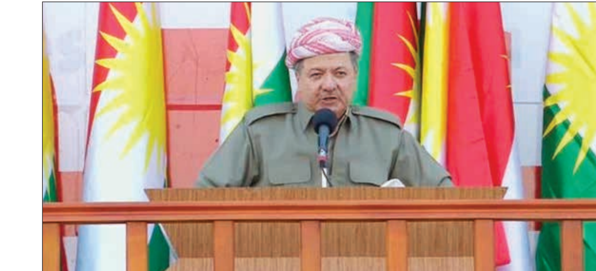
جانب من خطاب مسعود بارزاني أمس

الجد بل حاربوا الإقليم بدلا من تقديم حل سياسي للأمة. وأضاف إلى الاستفتاء لا يهدف لترسيم الحدود بين العراق والإقليم كردستان أو فرض الأمر الواقع عليها، وإنما يهدف لاستقلال الإقليم، مؤكداً أنهم لن يعودوا إلى الخط الأخضر الفاصل بين البيشمركة والجيش العراقي. وأعرب مسعود البارزاني عن استعداده لمواصلة التعاون مع الجيش العراقي وقوات التحالف ضد تنظيم داعش، معبرا عن شكره للقوات التحالف على مساعدته للإقليم خلال حربه ضد داعش، موضحاً في الوقت ذاته أن الكثير من أبناء كردستان