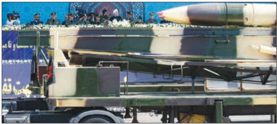
الرئيس الإيراني حسن روحاني يتابع لحظة عرض الصاروخ الباليستي الجديد القادر على حمل رؤوس نووية

تهران - وكالات: كشفت إيران خلال استعراض عسكري في طهران، أمس، عن صاروخ «خرمشر» الباليستي الذي يبلغ مداه 2000 كيلومتر وقادر على حمل رؤوس نووية، وذلك في تحد فاضح لقرارات مجلس الأمن الدولي والمضمون الاتفاق النووي، بحسب الأطراف الدولية. ونقلت وكالة «تسنيم» الإيرانية عن قائد القوة الجو - فضائية في الحرس الثوري، العميد أمير علي حاجي زاده، قوله إن «وزارة الدفاع صنعت صاروخ «خرمشر» لصالح الحرس الثوري، الذي يبلغ مداه 2000 كيلومتر وقادر على حمل رأس مدى 1800 كيلومتر، كما بإمكانه حمل عدة رؤوس بدلا من رأس واحد». وأكد حاجي زاده أن «عملية التدريب على صاروخ خرمشهر الباليستي بدأت وسيتم استخدامه قريباً في قوات الجو - فضائية في الحرس الثوري». وخلال العرض العسكري الذي نظم بمناسبة ذكرى اندلاع الحرب الإيرانية العراقية عام 1980، دافع الرئيس الإيراني حسن روحاني في كلمة عن