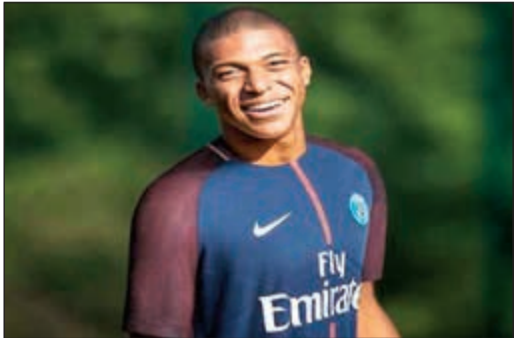
مبابي إيرز المرشح

تم الكشف عن القائمة الأولية لجائزة «الغولدن بوي» لأفضل لاعب شاب في أوروبا لعام 2017. وفاز بهذه الجائزة المرموقة بالفعل من قبل كل من لاعب برشلونة ليونيل ميسي عام 2005، فضلا عن سيسك فابريغاس عندما كان لاعبا مع أرسنال عام 2006. وضمت القائمة الحالية 25 لاعبا من بينهم الوافد الجديد لبرشلونة عثمان ديمبيلي، فيما تواجد من ريال مدريد لاعبان هما ثيو هيرنانديز ومايورال. وضمت القائمة أيضا مهاجم سان جرمان كيليان مبابي وحارس مرمى ميلان دوناروما وغابرييل خيسوس مهاجم مان سيتي.