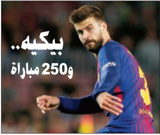
بيكيه.. و250 مباراة

حقق ليونيل ميسي نجم برشلونة حفنة أرقام جديدة في مسيرته الكروية ضد إيبار في الجولة الخامسة من الدوري الإسباني. وسجل ليو رباعية «سوبر هاتريك» ليحتفل بإحراز الهدف رقم 300 مع برشلونة بملعب كامب نو معقل الفريق الكاتالوني في كل البطولات، إضافة إلى هدفين مع منتخب الأرجنتين، خلال 180 مباراة خاضها بهذا الاستاد العريق، ليصل الإجمالي إلى 302 هدف. كما مارس البرغوث الأرجنتيني هوايته في هن شبك إيبار في جميع المباريات، وأرغما حصيلة إلى 12 هدفا في 6 لقاءات، ورفع ميسي رصيده إلى 9 أهداف يتصدر بها لائحة هدافي الليغا، محققا أفضل انطلاقة له في الليغا بعد مرور 5 جولات من المسابقة. وسجل ميسي الهاتريك رقم 43 في مشواره، وواقع 4 مع منتخب بلاده، و39 ثلاثية مع ناديه، منها 28 في الدوري الإسباني، كما رفع رصيده إلى 43 هدفا في 40 مباراة مع برشلونة في كل البطولات منذ بداية العام الحالي. ونذكرت شبكة «سكاي سبورتنس» أن أيقونة برشلونة سجل رباعية «سوبر هاتريك» للمرة السادسة في مشواره مع البارسا.