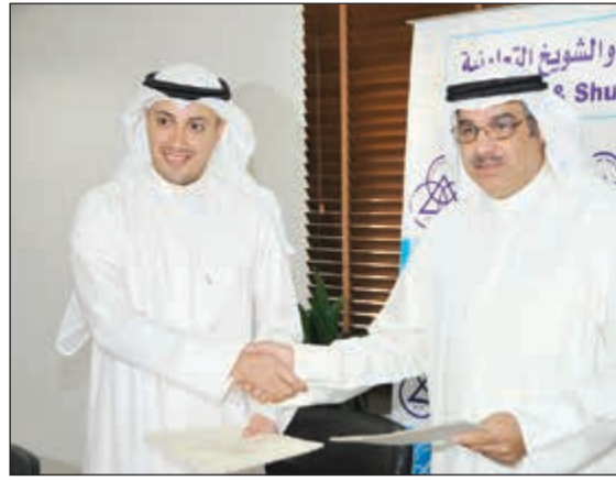
جانب من توقيع العقد