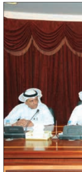
جانب من اجتماع رؤساء التعاونيات