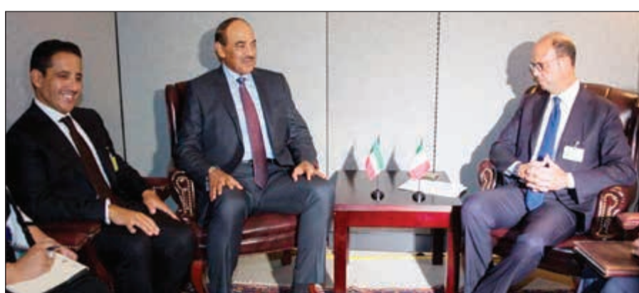
الشيخ صباح الخالد خلال لقائه مع وزير الخارجية والتعاون الدولي الإيطالي أنجيلينو ألفانو

حضر اللقاء مساعد وزير الخارجية لشؤون مكتب النائب الأول لرئيس مجلس الوزراء ووزير الخارجية السفير الشيخ د. أحمد ناصر المحمد ومندوب الكويت الدائم لدى الأمم المتحدة في نيويورك السفير منصور العتيبي ومساعد وزير الخارجية لشؤون المنظمات الدولية ناصر الهين وعدد من كبار المسؤولين في وزارة الخارجية. وقد التقى الخالد أيضا أمس مع وزير الخارجية العراقي إبراهيم الجعفري، وتم خلال اللقاء بحث سبل تطوير العلاقات الثنائية بين مستجدات القضايا الإقليمية والدولية. والتقى الخالد أيضا مع وزير الخارجية والتعاون الدولي في الجمهورية الإيطالية الصديقة أنجيلينو ألفانو، وتم خلال اللقاء مناقشة أوجه العلاقات الثنائية المتينة بين البلدين وسبل تعزيزها في كافة المجالات ومختلف