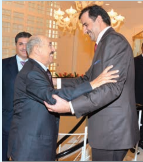
سمو الأمير مرحبا بأمير قطر