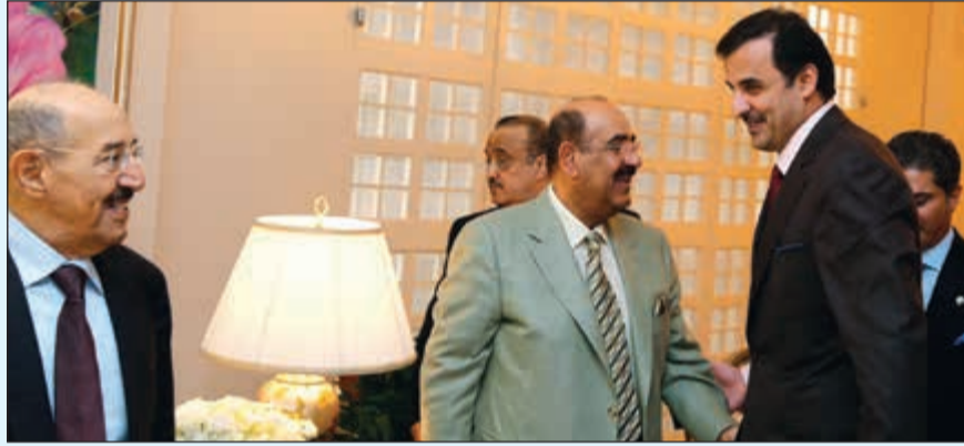
صاحب السمو الأمير وأمير قطر والشيخ مشعل الأحمد

استقبل صاحب السمو الأمير الشيخ صباح الأحمد ظهر أمس أخاه صاحب السمو الشيخ تميم بن حمد آل ثاني أمير دولة قطر الشقيقة والوفد المرافق لسموه وذلك في مقر الكويت لدى الأمم المتحدة بمدينة نيويورك.