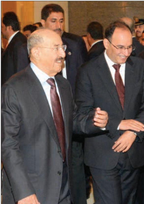
صاحب السمو الأمير والسفير منصور العتيبي