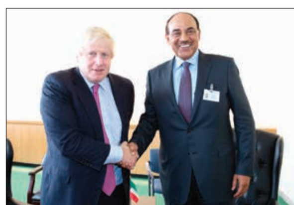
الشيخ صباح الخالد مع وزير الخارجية البريطاني بريس جونسون

المميزة التي تربط بين الكويت والاتحاد الأوروبي، مثنيا على الدور المهم الذي يضطلع به الاتحاد في تحقيق الأمن والاستقرار على الصعيدين الإقليمي والدولي. من جانبها أشادت فيديريكا موغريني بالعمل المشترك الوثيق الذي يربط بين الكويت والاتحاد الأوروبي والذي يمثل نموذجا للتعاون البناء بين المنظمة والدول.