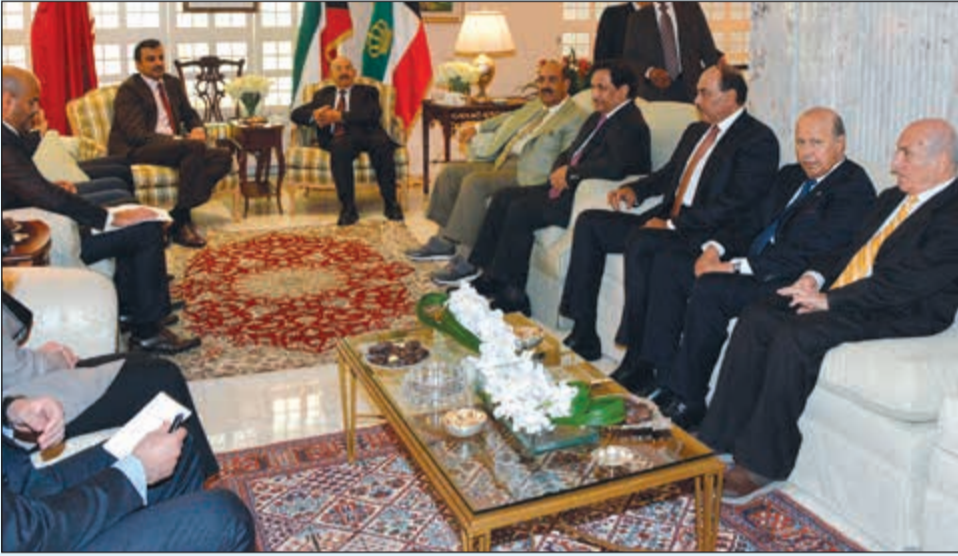
سمو الأمير وأمير قطر ووفدا البلدين خلال المباحثات