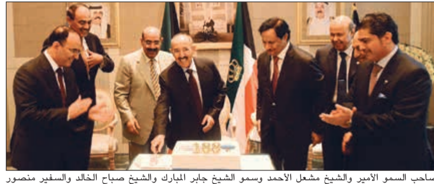
صاحب السمو الأمير والشيخ مشعل الأحمد وسمو الشيخ جابر المبارك والشيخ صباح الخالد والسفير منصور العتيبي والسفير أحمد فهد الفهد والمستشار محمد أبو الحسن والشيخ سالم العبدالله والشيخ خالد العبدالله

على شرف صاحب السمو الأمير الشيخ صباح الأحمد والوفد المرافق لسموه أقام مندوبنا الدائم لدى الأمم المتحدة السفير منصور العتيبي مأدبة غداء وذلك في مقر الكويت لدى الأمم المتحدة بمدينة نيويورك.