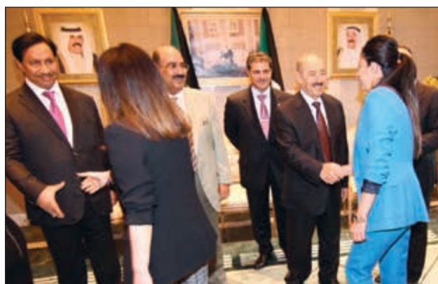
صاحب السمو مصافحا إحدى حاضرات المأدبة

على شرف صاحب السمو الأمير الشيخ صباح الأحمد والوفد المرافق لسموه أقام مندوبنا الدائم لدى الأمم المتحدة السفير منصور العتيبي مأدبة غداء وذلك في مقر الكويت لدى الأمم المتحدة بمدينة نيويورك.