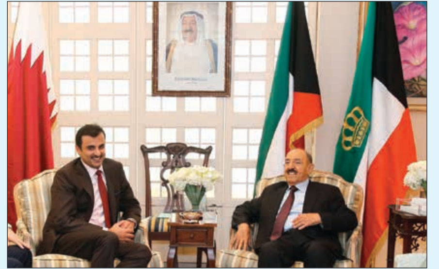
صاحب السمو الأمير والشيخ صباح الأحمد وصاحب السمو الشيخ تميم بن حمد أمير قطر