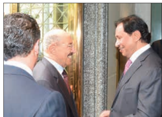
صاحب السمو الأمير مصافحا سمو رئيس الوزراء