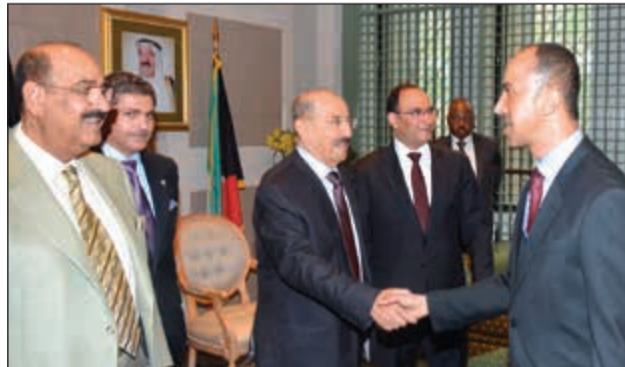
سمو الأمير مصافحا أحد الحضور