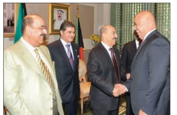
ترحيب بصاحب السمو الأمير