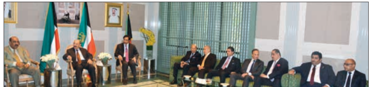
صاحب السمو الأمير والشيخ صباح الأحمد والشيخ مشعل الأحمد وسمو الشيخ جابر المبارك والسفير أحمد فهد الفهد والمستشار محمد أبو الحسن والشيخ سالم العبدالله والشيخ خالد العبدالله والشيخ فهد جابر المبارك