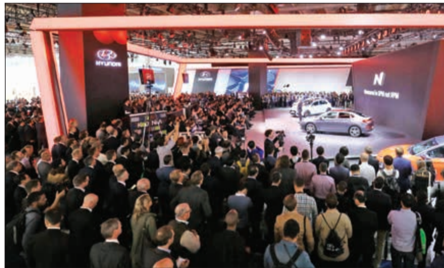
جناح هيونداي في معرض فرانكفورت الدولي للسيارات