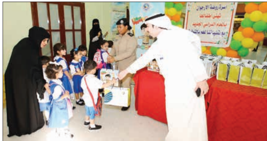
فريق بنك وربة يوزع الهدايا على أطفال روضة الأرجوان