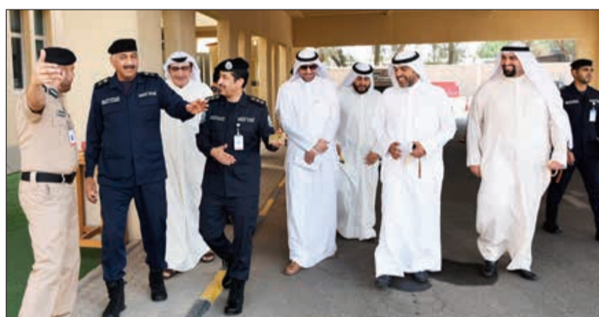
جولة في المقر الجديد لقسم اختبار مرور العاصمة