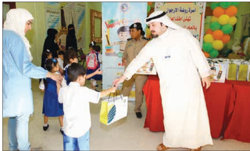
هدية لأحد الأطفال

مع انطلاقة موسم العودة إلى المدارس وحرصاً منه على مشاركة المعلمين، المعلمات، والطلاب الاحتفال بالعودة إلى المدارس، قام فريق إدارة الفروع وإدارة التسويق والعلاقات العامة في بنك وربة بزيارة عدد من المدارس لتوزيع الهدايا على الطلاب والاستمتاع معهم بأول أيام الدراسة وسط أجواء تعليمية ترفيهية.