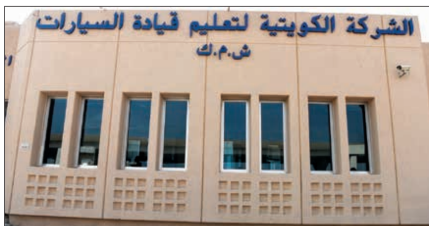
مقر الشركة الكويتية لتعليم قيادة السيارات

وقد تأسست شركة هاملتون عام 1892 في لانكستر، بنسلفانيا، في الولايات المتحدة الأميركية. تجمع ساعات هاملتون بين الروح الأميركية والدقة الفريدة التي تتميز بها أحدث آليات الحركة والتكنولوجيا السويسرية. وتملك هاملتون المعرفة بتصميمها المتكبرة موثقاً وقدم وثيقاً في هوليوود يظهر منتجاتها في أكثر من 450 فيلماً، كما افتخر العلامة بتراث عريق في الملاحاة الجوية. تنتمي شركة هاملتون إلى مجموعة سواتش، أكبر مصنع وموزع ساعات في العالم.