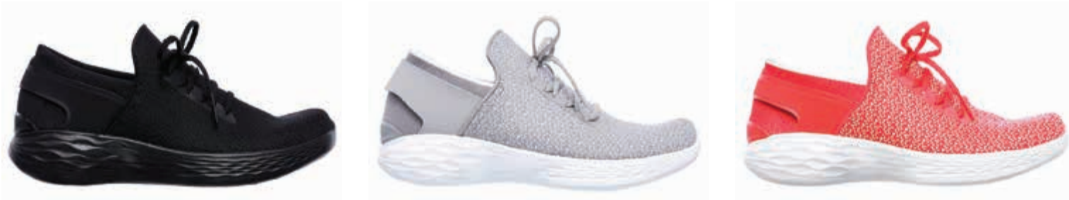
تصميمات عصرية والوان مميزة

الخفيفة والصحية في سوق منتجات الترفيه الرياضي»، وقال أيضاً: «منحتنا فرصة لتجربة دمج أفضل مظهر للأداء والموضة التي تلبي احتياجات نمط الحياة العصرية. ونحن نتوقع أن تلاقى هذه المجموعة رواجاً كبيراً من قبل النساء العمليات من كل شرائح المجتمع».