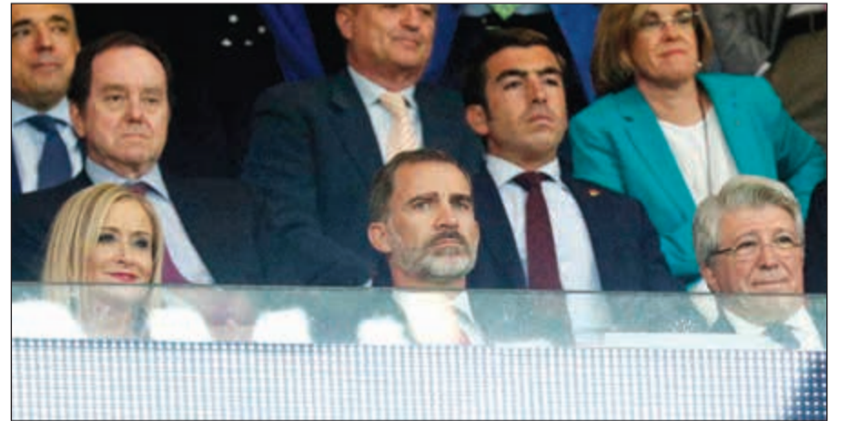
الملك فيليبي السادس حضر الافتتاح

وهبط ثلاثة مظليين من سلاح الجو الإسباني على أرض الملعب وهو يحملون كرة المباراة، لأن اتلتيكو مرتبط تاريخياً بهذا السلاح بسبب اندماج النادي مع شعبية كرة القدم التابعة له تحت نظام الديكتاتور فرانكو (1939-1975). ولعبت ركلة البداية «الوهمية» تحت انظار الملك فيليبي السادس من قبل ممثلين لثلاثة أجيال هم نجم سبعينات القرن الماضي خوسيه أولوجيو غاراني واللاعب الحالي فرناندو توريس، ولاعب شاب من مركز التأهيل. وسجل الملعب الجديد والحديث جدا الذي شيد في الضاحية الشرقية المتطورة للعاصمة مدريد، محل استاد فيسنتي كالدرون الذي يتسع لـ 55 ألف متفرج. واتي الاسم «ميتروبوليتان» من الملعب القديم الذي لعب عليه اتلتيكو من 1923 إلى 1966 قبل الانتقال إلى فيسنتي كالدرون، وقد فازت بحق تسمية الملعب الجديد شركة «واندا» العائدة للملياردير الصيني وانغ جيان لين، مالك 20٪ من رأسمال النادي المرديدي منذ عام 2015.