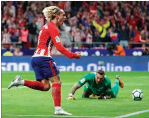
غريزمان يسجل الهدف الوحيد بالمباراة