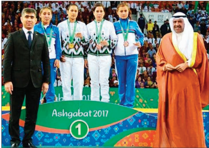
الفهد بعد تسليمه أول ميدالية ذهبية في الدورة

نصيب تركمانستان. وقال الفهد: أنا سعيد جداً لهذه الميدالية الذهبية، إنه شعور رائع، وأمل أن يحصل رياضيون آخرون من تركمانستان على الميداليات الذهبية أيضاً.