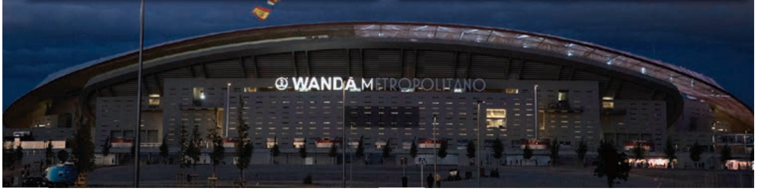
صورة للاستاد من الخارج وفي الإطارة لقطتين لجمهير النادي وللإستاد من الداخل أثناء الاحتفال