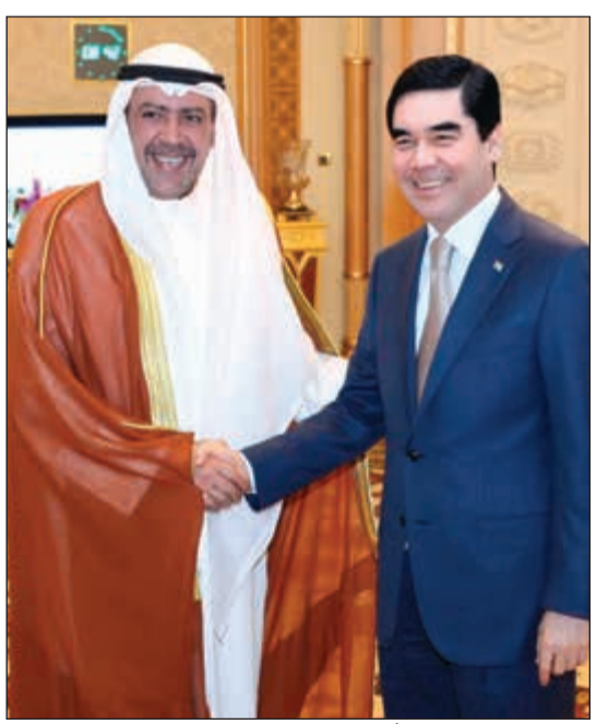
الشيخ أحمد الفهد مصافحاً الرئيس التركمانستاني غربانغولي بردي محمدوف

استقبل رئيس جمهورية تركمانستان غربانغولي بردي محمدوف في العاصمة عشق آباد الشيخ أحمد الفهد رئيس المجلس الأولمبي الآسيوي وذلك قبل الانطلاق الرسمي لدورة الألعاب الآسيوية الخامسة للصالات والفنون القتالية. وتستضيف عشق آباد الألعاب الآسيوية للصالات من 17 إلى 27 سبتمبر. وكان الفهد وصل إلى عشق آباد بعد أن جددت الجمعية العمومية للجنة الأولمبية الدولية الثقة الدولية به بإعادة انتخابه عضواً في اللجنة الأولمبية الدولية لثمان سنووات جديدة في ليمّا عاصمة البيرو.