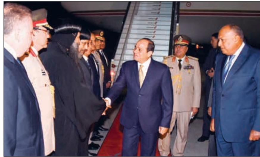
الرئيس عبدالفتاح السيسي يصفاح مستقبليه عقب الوصول الى نيويورك

ويشارك الرئيس أيضا في الاجتماع الخاص بالوضع في ليبيا الذي تنظمه الأمم المتحدة سعيا لدعم جهود التوصل إلى تسوية سياسية لازمة هناك. وتشهد زيارة الرئيس السيسي لنيويورك نشاطا مكثفا على المستوى الثنائي بين مصر والولايات المتحدة، حيث من المنتظر أن يعقد الرئيس لقاء مع الرئيس الأميركي دونالد ترامب،