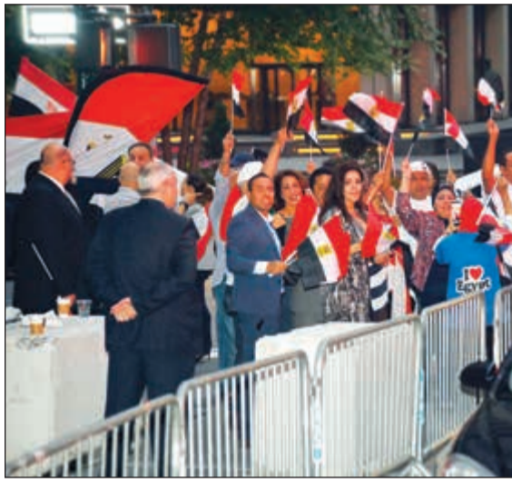
الجالية المصرية تحتفل في نيويورك بوصول الرئيس السيسي