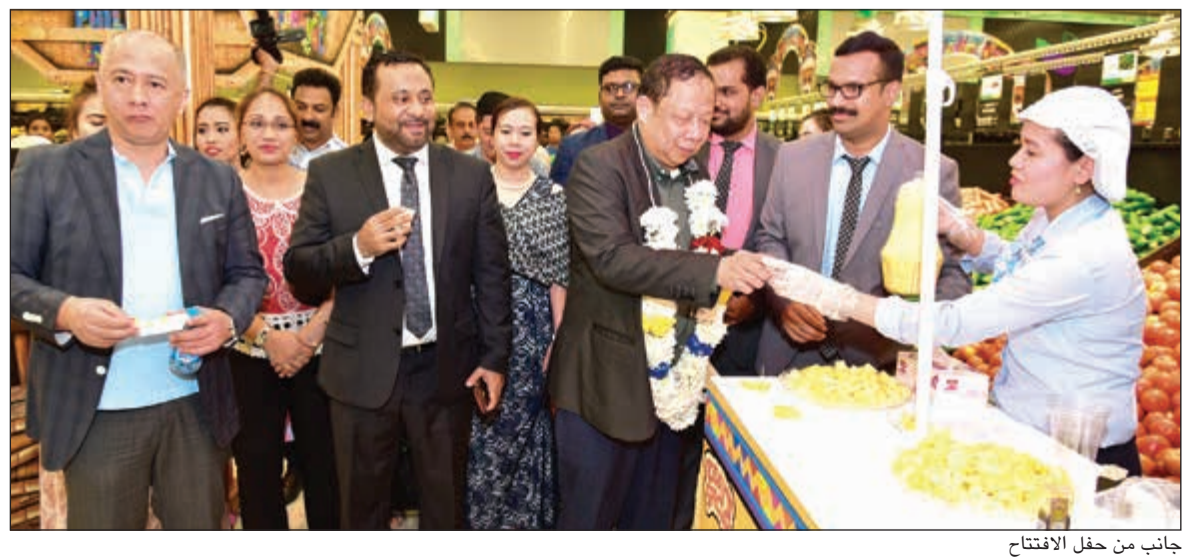
جانب من حفل الافتتاح

المستمرة للتفاعل بانتظام مع عملائه من خلال العروض الترويجية والمهرجانات الشعبية للغاية، وتشكل هذه العلاقة التآزرية مع العملاء