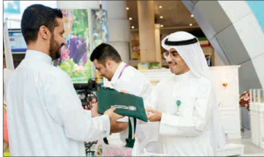
جانب من أنشطة الحملة

حظيت الحملة التي نظمتها بيت التمويل الكويتي (بيتك) بمناسبة موسم الحج في إطار الرعاية والاهتمام بحجاج بيت الله الحرام بإشادة وتقدير كبيرين، نظراً لتكامل الحملة وشموليتها للعديد من الأنشطة والفعاليات وتنسيقها مع الجهات الرسمية المعنية بمساعدة الحجاج، واستخدام وسائل متعددة ومتنوعة لتقديم كافة الإرشادات والنصائح والتعليمات والضوابط الدينية والصحية والتنظيمية التي تغفل لكل حاج أداء المناسك ببسر وسهولة، حيث يحرص «بيتك» من خلال تفعيل دوره الاجتماعي على المشاركة في المناسبات الدينية الوطنية بما يضمن تحقيق أقصى منفعة ممكنة لأفراد المجتمع ومؤسساته الرسمية. وقد بدأت حملة «بيتك» لخدمة ورعاية الحجاج هذا العام منذ التحضيرات الأولية لموسم الحج باستخدام وسائل التواصل الاجتماعي، حيث بثت صفحات «بيتك» مجموعة من الرسائل التوعوية الدينية من الشيوخ الأفاضل والعلماء الأجلاء التي تبين للحجاج أركان الفريضة وسننها وفضل الحج، كما قدمت نصائح طبية ضمن الحملة الوطنية لتوعية الحجاج وإرشادهم بالتعاون مع وزارة الصحة مما ساهم بشكل كبير في تعزيز الثقافة الطبية لدى الحجاج وتوفير