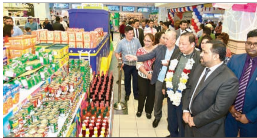
جولة على المنتجات

واحدة من الأسباب التي تجعل علامة لولو هايبر ماركت تحتفظ بهذه المتابعة الكبيرة والمخلص بين المتسوقين في المنطقة.