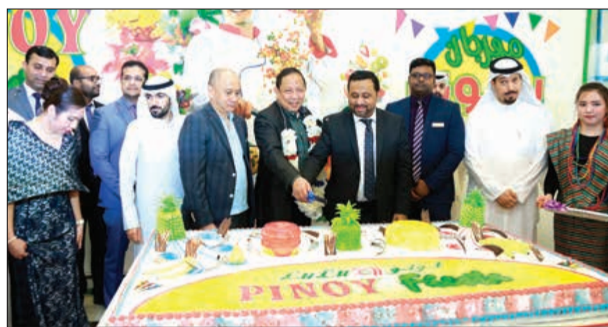
السفير الغلبيتي يشارك في قطع كيك الحفل

تجسد ساعة شويارد الجديدة «Superfast Power Control Porsche 919 HF Edition» خلاصة الأداء الفائق لما تتميز به من وزن خفيف وكفاءة عالية وتقنيات متطورة. وقد أطلقت دار شويارد هذه الساعة احتفالاً بالفوز الذي حققه شريكها فريق بورشه موتورسبورت في بطولة العالم لسباقات التحمل (WEC). وتتشارك ساعة شويارد الجديدة بالكثير من المزايا مع سيارة بورشه الهجينة «919 Porsche Hybrid»، التي استحدثت منصة التتويج في مختلف فعاليات البطولة، لتسلط ساعة شويارد الضوء من جديد على نهج صناعة الساعات في شويارد المتطور حول تقديم أفضل تقنيات وأداء. وتتشارك شويارد مع فريق بورشه موتورسبورت (LMPI) منذ عودته للمشاركة في بطولة العالم لسباقات التحمل (WEC) عام 2014. وأطلقت شويارد مجموعة محدودة من الساعات احتفالاً بالانتصارات العديدة التي حققتها شركة بورشه الألمانية انطلاقاً من مقرها في مدينة شتوتغارت عبر فريقها ضمن بطولة العالم لسباقات