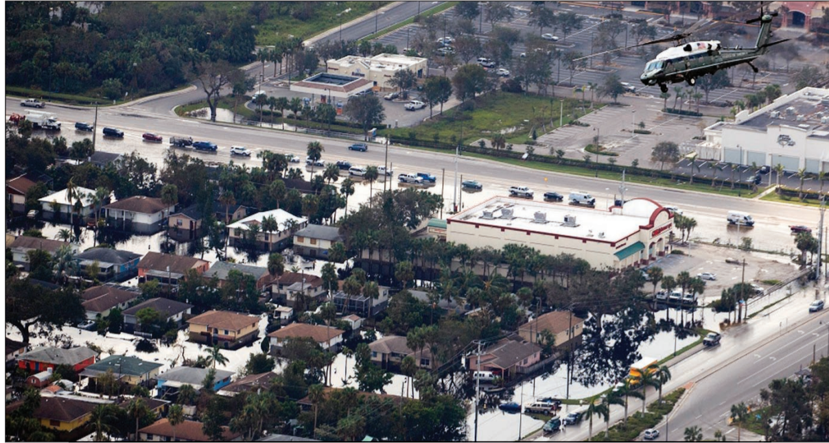
طائرة ترامب تطلق فرق ولاية فلوريدا خلال تفقده الأضرار التي لحقتها الإعصار إيرما أمس

التيار الكهربائي ظللاً على زيارة ترامب، حيث ترجح السلطات في فلوريدا أن يكون توقف أجهزة التكييف وراء وفاة المسنين الثمانية، وفقاً لقائد الشرطة المحلية توماس سانشين.