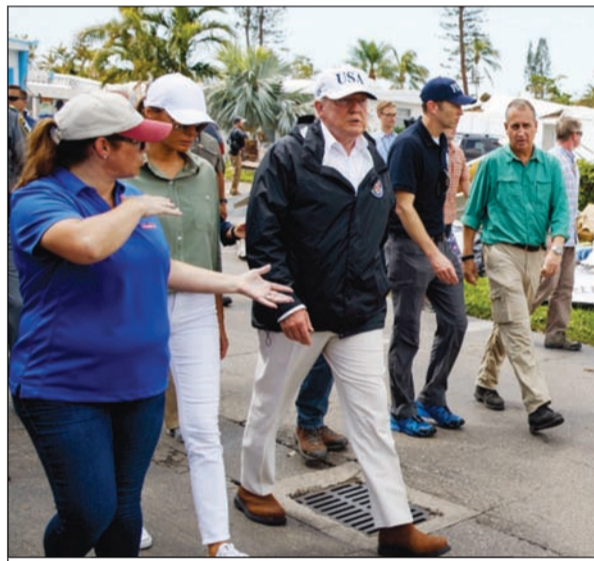
ترامب خلال جولته التفقدية في فلوريدا

وقال ترامب لدى وصوله إلى منطقة فورث مايرز الواقعة على الساحل الغربي لفلوريدا، أكثر المناطق تضرراً من الإعصار: «لقد شاهدنا الدمار، وسنرى