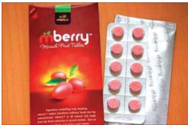
حبوب الفراولة المنتشرة

رصدت أجهزة الداخلية حبوباً يتم تداولها بين الطلاب باسم الفراولة السريعة، وذكر مصدر أمني أن الحبوب أرسلت إلى الأدلة وتثبتت خطورتها البالغة على الأجهزة العصبية وأنها تؤدي إلى تركيز مؤقت ولكنها تصعب إيماناً صعب التخلص منه أو تجاوزه. ودعا المصدر أولياء الأمور وإدارات المدرسة إلى تحذير الأبناء من تداول هذه الحبوب وعدم حيازتها بأي شكل من الأشكال، مؤكداً جاهزية الداخلية لتلقي أي بلاغات بشأن تجار يروجون هذه الحبوب بين طلاب المدارس أو الجامعات. ورداً على سؤال حول مصدر الحبوب قال المصدر: إن الحبوب ثبت أنها واردة من دولة آسيوية، وأن تنسيقاً تم مع الجمارك بمصادرتها وهناك نية لإدراجها في جدول المنوعات.