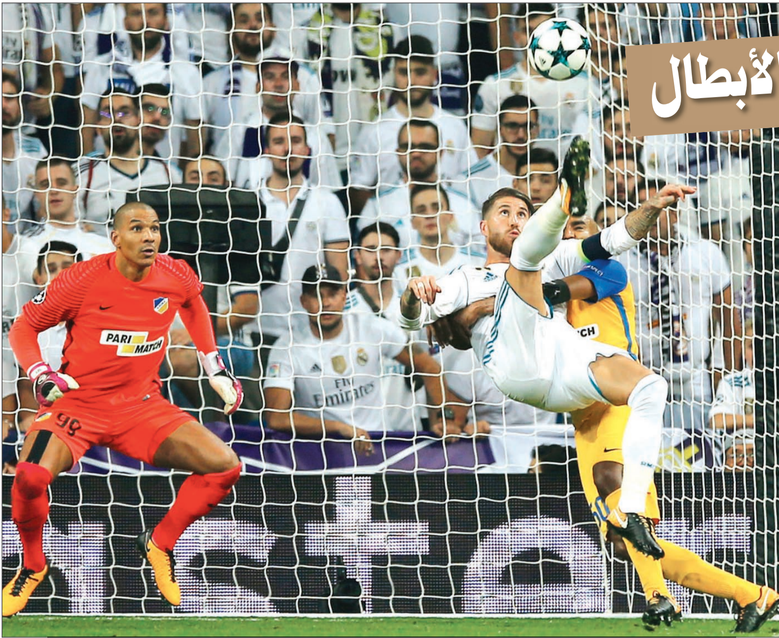
مقصية رائعة من سيرجيو راموس في طريقها لشباك أبويل