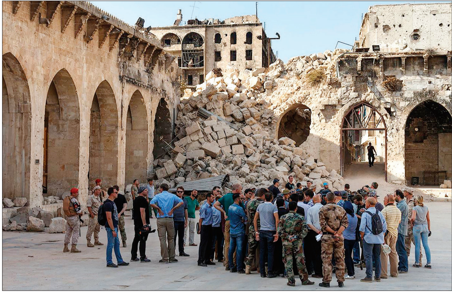
صورة نشرتها وزارة الدفاع الروسية لجولة للصحافيين الأجانب في الجامع الأموي الكبير القديم في حلب أول من أمس