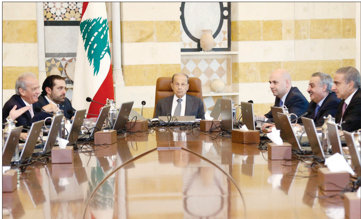
الرئيس العماد ميشال عون مترسلاً جلسة مجلس الوزراء في بعبدا (محمود الطويل)

انتهت أمس زيارة رئيس الحكومة سعد الحريري لتبدأ زيارة الرئيس ميشال عون نهاية هذا الأسبوع إلى نيويورك لترؤس وفد لبنان إلى الدورة الـ 71 للأمم المتحدة، ومن ثم الانتقال إلى باريس في زيارة رسمية. وستكون الخروقات الإسرائيلية للسيادة اللبنانية المادة الأساسية في خطاب الرئيس عون أمام الأمم المتحدة بالإضافة إلى محاربة الإرهاب والإعلاء المترتبة على لبنان جراء النزوح السوري، أما في باريس فيضاف إلى مضمون هذا الخطاب العلاقات الثنائية ومؤتمر «باريس 4» لدعم لبنان.