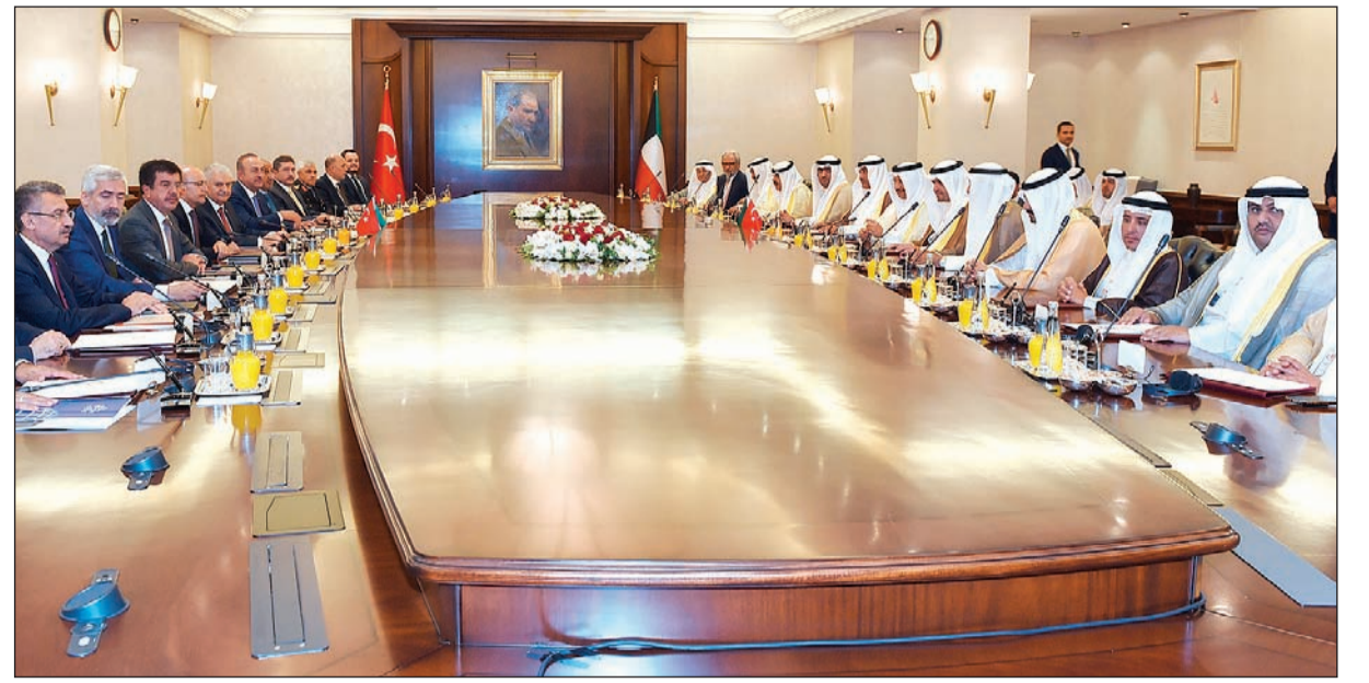
جانب من جلسة المباحثات بين سمو رئيس مجلس الوزراء الشيخ جابر المبارك ونظيره التركي بن علي يلدريم