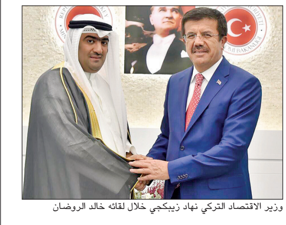
وزير الاقتصاد التركي نهاد زيبيجي خلال لقائه خالد الروضان

وأضاف انهما «ناقشا كذلك التجارة البينية في المنطقة، وإضافة القضاء بـ «المنافسة» ان أبقى الوزير التركي التفهم والرؤى المشتركة مع مقترحات الجانب الكويتي.