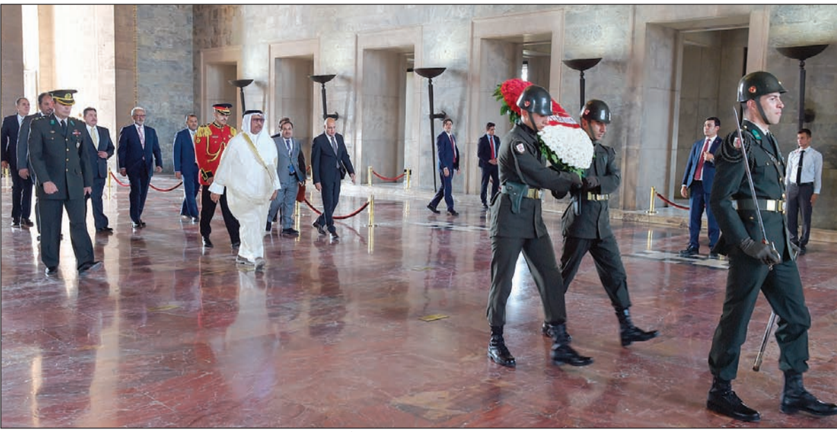
سمو رئيس مجلس الوزراء الشيخ جابر المبارك خلال زيارته النصب التذكاري لمصطفى كمال أتاتورك