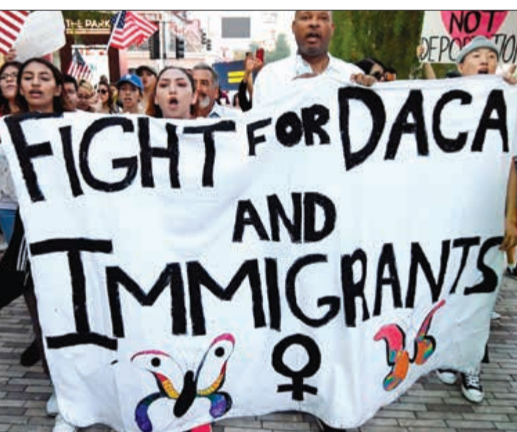
متظاهرون يرفعون لافتات تدافع عن المهاجرين خلال مسيرة احتجاجية في لوس انجليس امس الاول

كومي، وطالب بإحالة التي تحقيق خاص بسبب ما يمكن أن يكون تصرفات غير قانونية قام بها خلال فترة عمله. وقالت سارة هاكبي ساندرز الناطقة بلسان ترامب إن «الرئيس فخوره بقراره فصل كومي. لقد كان الرئيس محققاً بنسبة 100٪، وهو كان يعرف آنذاك أن القرار ربما يكون سيئاً من الناحية السياسية بالنسبة له إلا أنه شعر مع ذلك بأن عليه واجب بأن يتخذ الخطوة الصحيحة أمام الشعب الأميركي وبالتأكيد أمام العاملين في مكتب التحقيقات الفيدرالي».