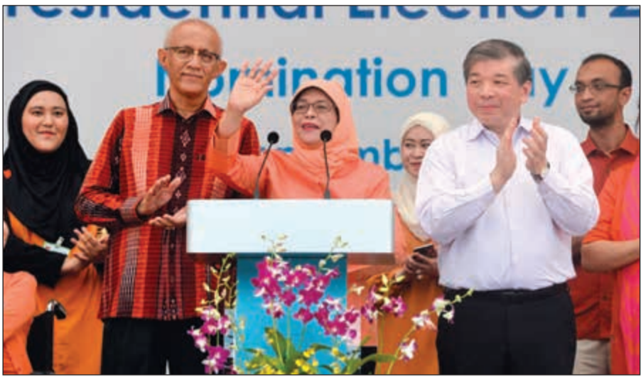
حليمة يعقوب وسط مؤيديها عقب إعلان مركز الانتخابات فوزها بالنزكية بمنصب رئيس سنغافورة

منافسيها بموجب قانون الانتخابات. وحليمة يعقوب (62 عاماً) التي ستتولى رئاسة سنغافورة لمدة 6 سنوات، خلفاً لتوني تان تينغ يام، مسلمة من أب هندي وأم مالوية، ومتزوجة من رجل الأعمال المتقاعد اليميني، محمد عبدالله الحديشي. وفي وقت سابق من الأسبوع الجاري، أعلنت لجنة الانتخابات، أن اثنين من المرشحين الأربعة الآخرين ليسوا من الملايو، بينما لم يحصل الأخران على شهادة تأهيل للمنافسة على المنصب. وكان آخر شخص من الملايو يشغل منصب رئيس الدولة يوسف إسحق، من 1965 و1970 وهي أولى سنوات الدولة بعد الاستقلال، ولا تزال صورته مطبوعة على أوراق النقد في البلاد.