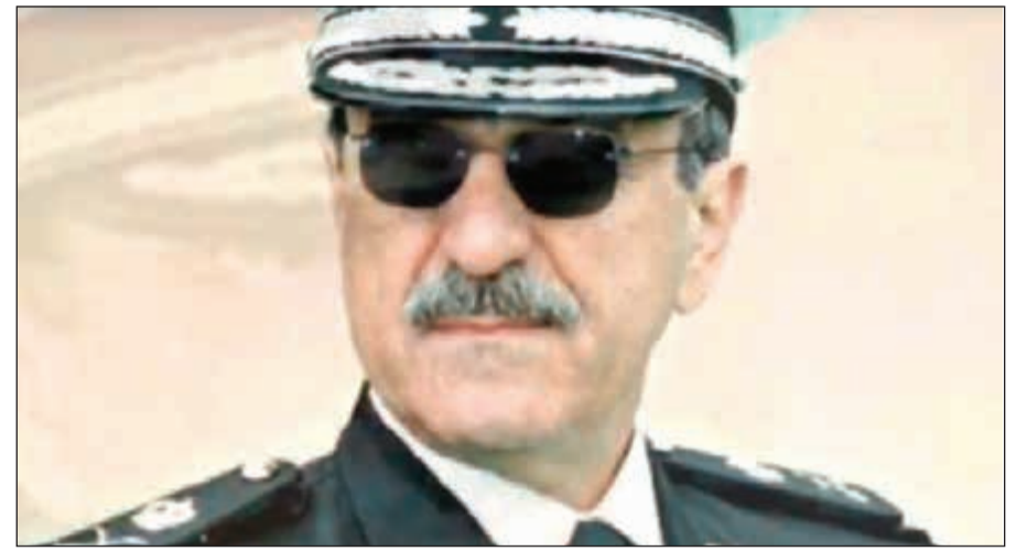
المقدم الركن الشيخ عذبي خالد اليوسف