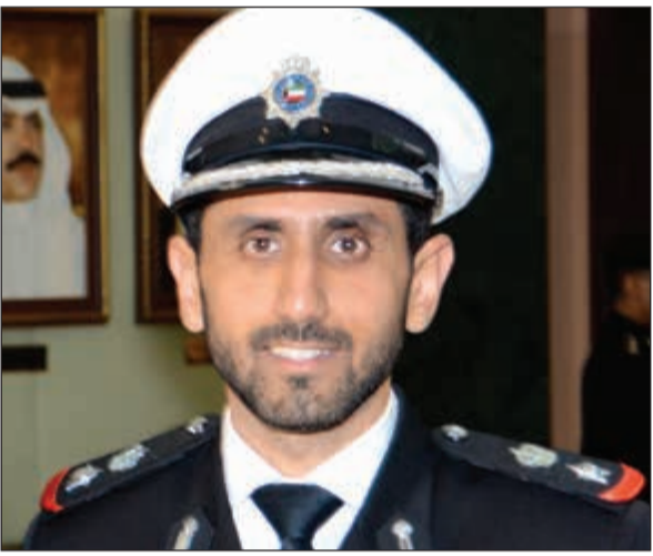
المقدم الركن الشيخ مبارك العلي اليوسف الصباح

■ علي صباح السالم رحمه الله اسطورة.. ■ أم سعود أعطتني كنزاً لا يُقدر بثمن