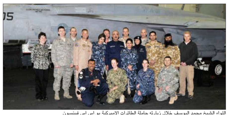
اللواء الشيخ محمد اليوسف خلال زيارته حاملة الطائرات الأميركية يو اس فينسون