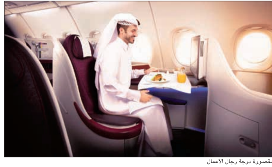
مقصورة درجة رجال الأعمال