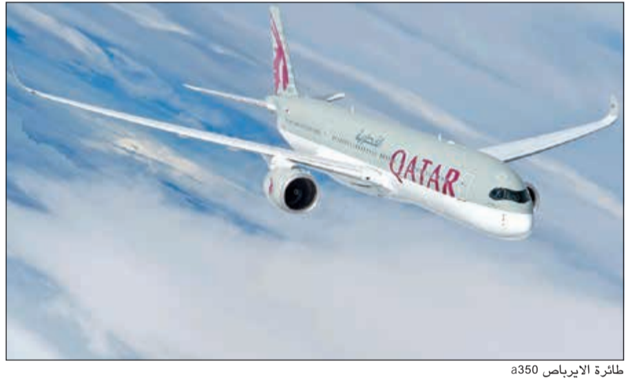
طائرة الأيرباص a350