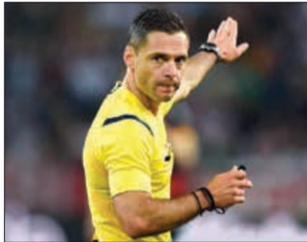
السلفوني دامير سكوميا

أعلن الاتحاد الأوروبي لكرة القدم (يويفا) قائمة الحكام الذين سيقودون اليوم الأول من منافسات دور المجموعات بدوري أبطال أوروبا، الثلاثاء المقبل.