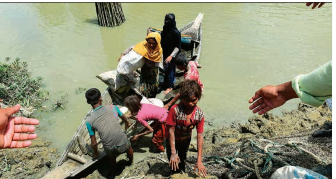
أسرة من مسلمي الروهينغا عقب الوصول إلى بنغلاديش عن طريق قارب هرباً من مجازر بورما

وكانت سو تشي قالت إنه لا يمكن حل الأزمات كافة التي تعاني منها البلاد خلال 18 شهراً، مؤكدة أن إيجاد حل مناسب لأزمة الروهينغا يتطلب بعض الوقت.