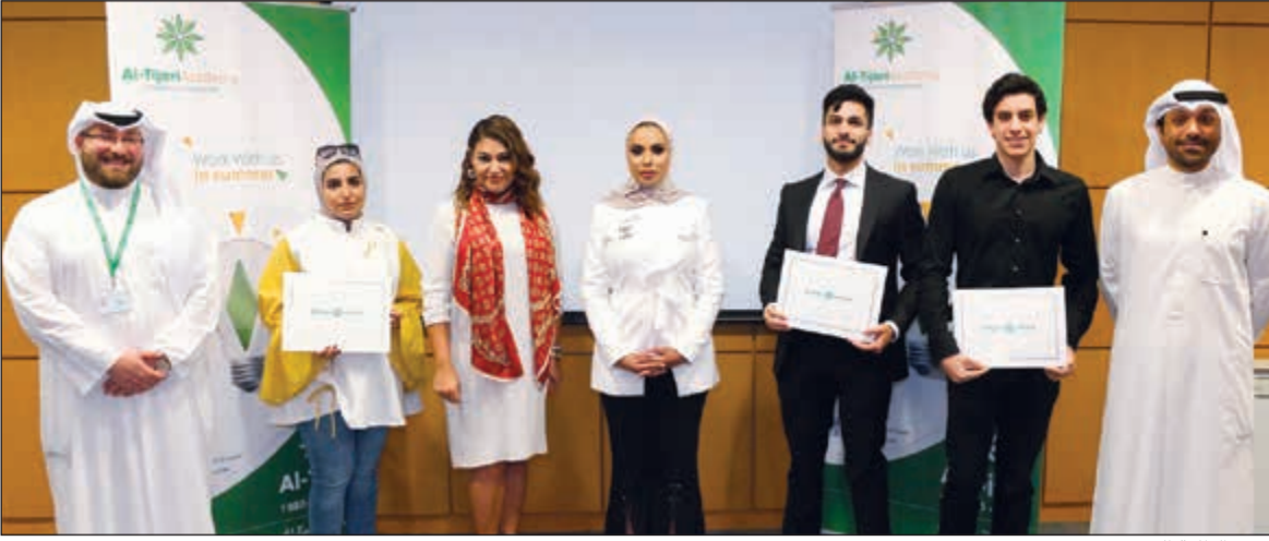
تكريم الطلبة الخريجين

إبداعية متميزة. بدورهم، أعرب المتدربون -عند استلام شهادة استكمال التدريب- عن سعادتهم بالتدريب الذي حصلوا عليه في البنك والذي ساهم في تطوير مهارات التواصل لديهم وقدم لهم معلومات هامة عن العمل المصرفي وطبيعة عمل الأفرع. والبنك التجاري الكويتي إذ يهنئ المتدربين على إتمام تدريبهم بنجاح، فإنه يؤكد على جهوده الرامية إلى بناء المستقبل معاً والتي تترجم على أرض الواقع من خلال البرامج التدريبية التي ينظمها البنك لشباب الخريجين الكويتيين من أجل استقطابهم للعمل في البنك التجاري الكويتي بهدف خلق جيل واعد من المصرفيين الجدد.