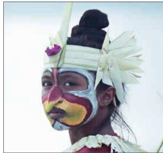
فيلم «المرئي والمخفي»

التي تعرض في تورنتو وحظيت بدعم المؤسسة أفكارا وقضايا ومفاهيم رائعة حول حياتنا وتعكس آمال وتطلعات الإنسان وكذلك تظهر التحديات التي يواجهها فكل فيلم هو امرأة ملهمة عن العالم الذي نعيش فيه في تحقيق التغيير الاجتماعي الإيجابي.. جدير بالذكر انه من الأفلام التي دعمتها مؤسسة الدوحة للأفلام ضمن برنامج المنح وتشهد عرضها العالمي الأول في مهرجان تورنتو السينمائي الدولي 2017: «الرحلة» للمخرج محمد جبارة الدراجي، «كباش ورجال» للمخرج كريم سيد، «المرئي والمخفي» للمخرجة كاملة أنديني، «الجانب الآخر من كل شيء» للمخرجة ميلا توريليتش، «أوا» للمخرجة صدف فروغي، «زيارة الرئيس» للمخرج سيريل عريس.