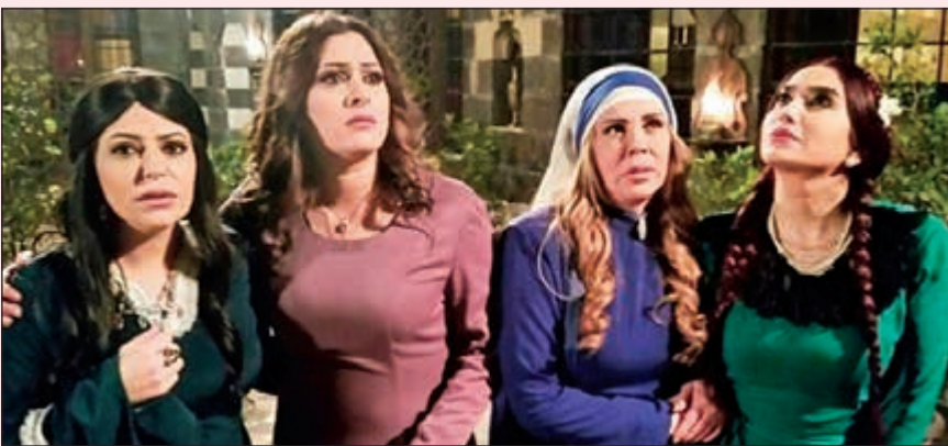
مشهد يجمع بطولات المسلسل

الهدف من هذه الخماسيات هو الإضاءة بال العلاقات الإنسانية والحب لا يعرف خادمة وسيدها، ومن هنا تكون الإضاءة على تناقضات المجتمعات العربية وما تعرض له. وتابع قاووق: لا تقتصر الخماسيات على ذلك، فقد ناقشنا حب المدرسة لتلميذها سواء بالجامعة أو المدرسة في إسقاط على الرئيس الفرنسي إيمانويل ماكرون وزوجته، وبالمقابل هناك سيدات يفضلن تربية الكلاب والقطط على الزواج والإنجاب، وكيف أن إحدى السيدات رفضت الإنجاب وقامت باقتناء كلب، وعندما تعرض «كلبها» لحادث دس أقامت الدنيا ولم تقعدا، هذه الأعمال حاليا تكتب، ونقوم بتصويرها عبر حلقات سداسية أو خماسية.