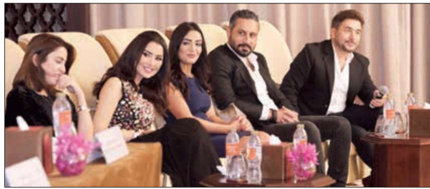
جانب من النجوم المشاركين في الجائزة