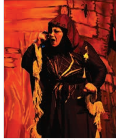
الطباخ في مسرحية «الفارس وأميرة الغابة»