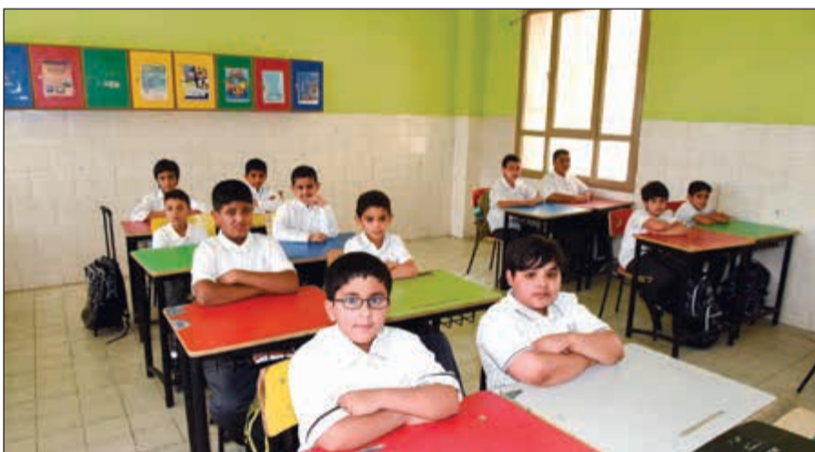
الفصل كامل العدد

من جانبه، أكد النائب محمد الحويلة أن الزيارة التفقدية تأتي في إطار