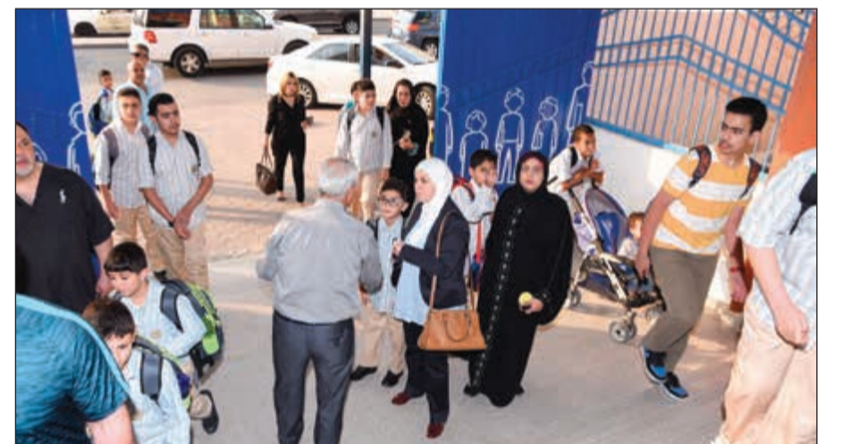
استقبال الطلبة وذويهم