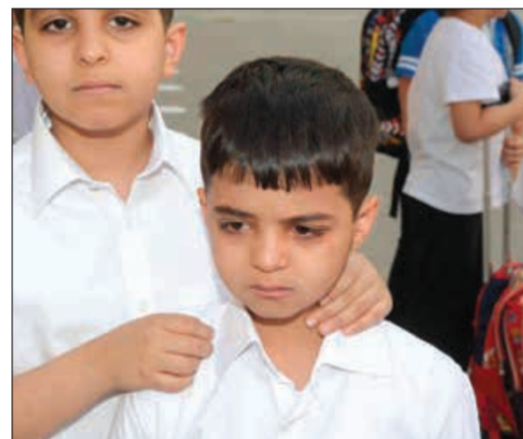
مشاعر متفارة في اليوم الأول لدى الطلاب