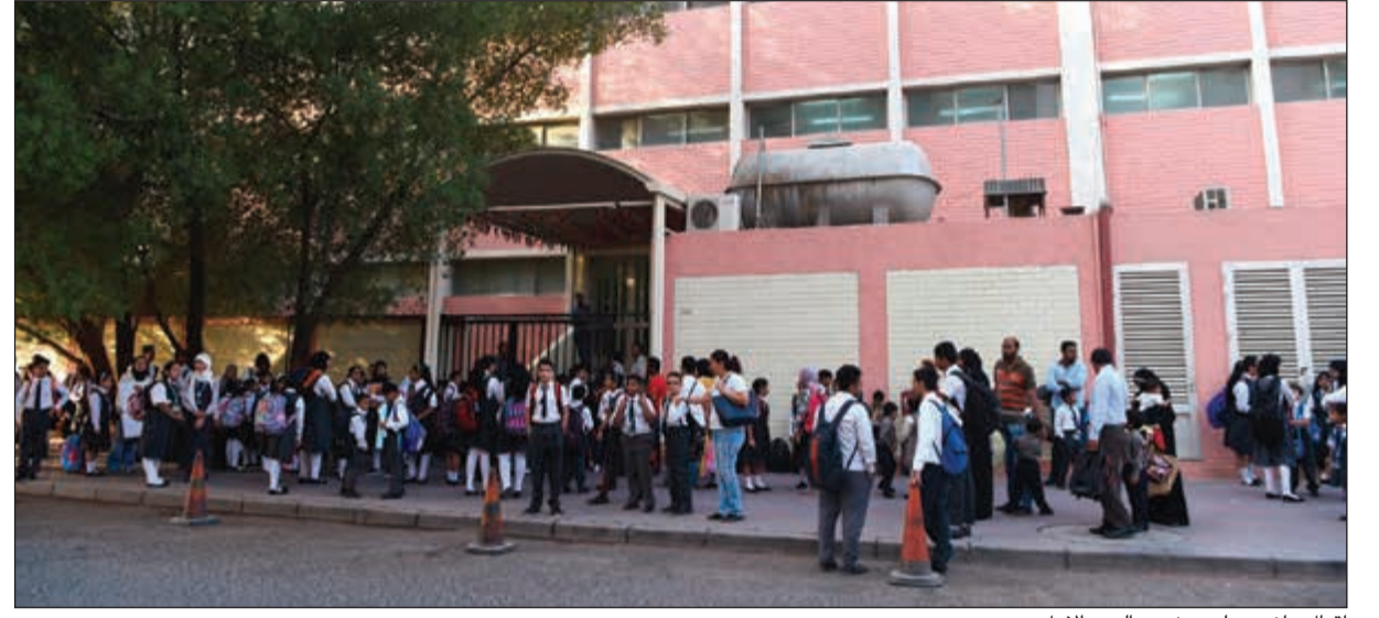
أقبال واضح على حضور اليوم الأول