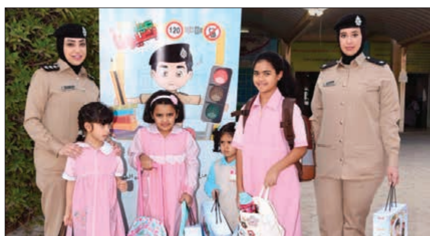
منتسبات الداخلية يوزعن البروشورات والهدايا على الطلبة

الطريق، مشيرة إلى أن الهدف الأسمى لتلك الخطة هو سلامة الأبناء والحد من الأخطاء على الطريق التي عادة ما تكون سبباً في وقوع الحوادث المرورية. وأوضحت أن الخطة يتم تنفيذها عبر وسائل الإعلام المختلفة (المقروءة والمسموعة والمرئية) بالإضافة إلى مواقع التواصل الاجتماعي الخاصة بوزارة الداخلية (تويتر وانستغرام) moikuw المزيد من التوعية الأمنية والمرورية لدى طلبة المدارس. وأشارت إلى أهمية الدور التوعوي في ترسيخ قواعد وأسس ومفاهيم صالحة في نفوس الطلبة والطالبات منذ الصغر لإيجاد جيل واع.