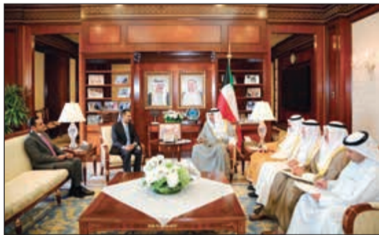
الشيخ صباح الخالد مستقبلا السفير الأردني الجديد