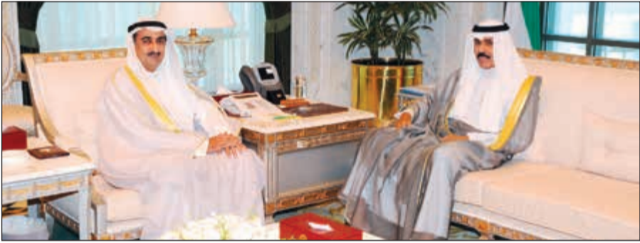
سمو نائب الأمير خلال لقائه د. يوسف العلي

استقبل سمو نائب الأمير وولي العهد الشيخ نواف الأحمد بقصر السيف صباح أمس رئيس جهاز الأمن الوطني الشيخ ثامر العلي. كما استقبل سمو نائب الأمير وولي العهد بقصر السيف صباح أمس د.موسى الحمدود. واستقبل سمو نائب الأمير وولي العهد، حفظه الله، بقصر السيف صباح أمس د.يوسف العلي.