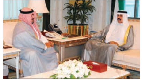
سمو نائب الأمير وولي العهد مستقبلا الشيخ ثامر العلي