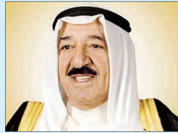
صاحب السمو الأمير الشيخ صباح الأحمد

الكويت الرفض للإرهاب بجميع أشكاله وصوره، سائلًا سموه المولى تعالى أن يتغمده ضحايا هذا الهجوم الإرهابي بواسع رحمته ومغفرته ويلهم ذويهم جميل الصبر وحسن العزاء، وأن يمن على المصابين بسرعة الشفاء والعافية. وبعث سمو نائب الأمير وولي العهد الشيخ نواف الأحمد ببرقية تعزية إلى أخيه الرئيس عبدالفتاح السيسي رئيس جمهورية مصر العربية الشقيقة ضمنها سموه خالص تعازيه وصادق مواساته بضحايا الهجوم الإرهابي الذي استهدف أليات للشرطة بمدينة