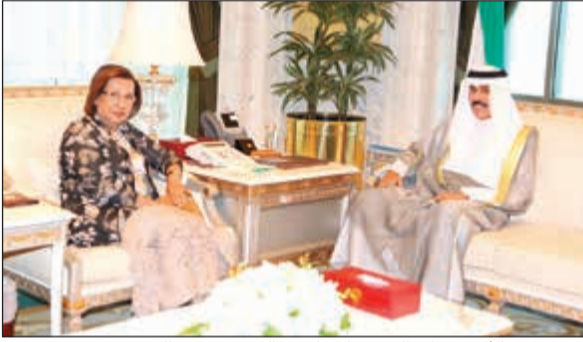
سمو نائب الأمير وولي العهد خلال استقباله د. موسى الحمدود