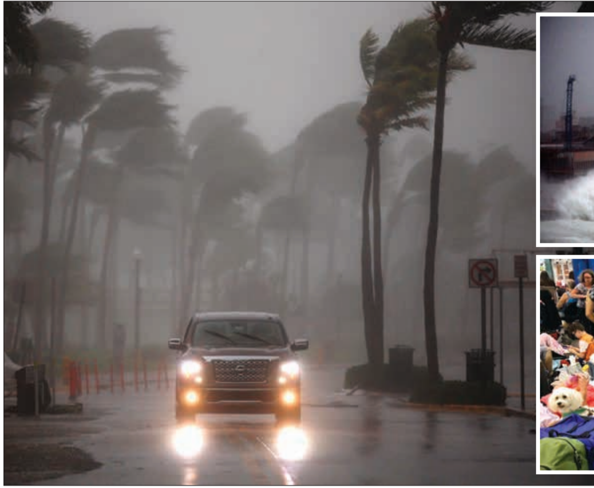
(أ.ف.ب - رويترز - أب)

«الأبناء» تواصلت مع «أبو خالد» الذي طمان جمهوره في الكويت والخليج بأن حالته الصحية حاليا مستقرة، شاكرًا الهيئة الطبية في المستشفى على متابعة حالته المرضية أولاً بأول. و«الأبناء» تتمنى من المولى، عز وجل، الشفاء العاجل للصلال ليعود إلى بيته وجمهوره سالماً معافياً.