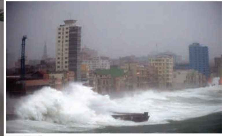
الإعصار وقد تسبب في تشريد الملايين في فلوريدا