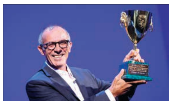
الممثل كمال الباشا

ويؤدى الباشا في «القضية رقم 23» دور ياسر سلامة، وهو لاجئ فلسطيني في لبنان يشرف على ورشة أشغال عامة في بيروت، وتحصل مشادة بينه وبين طوني وهو مسيحي لبناني، ويأخذ الصراع بعداً كبيراً فيتواجه الرجلان في المحكمة. ويصبح البلد على شفير انفجار بسبب التضخيم الإعلامي للقضية.