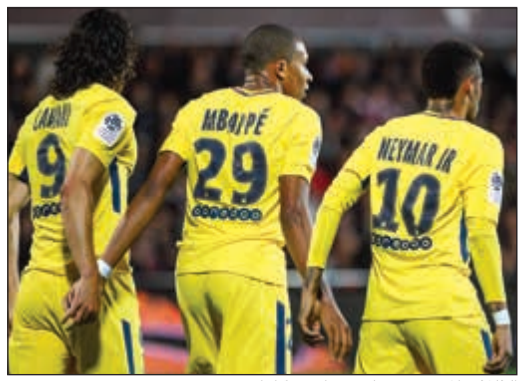
الثلاثي المدمر.. نيمار ومبابي وكافاني

أكد الفرنسي تييرى هنري، لاعب أرسنال وبرشلونة السابق، أن باريس سان جرمان أصبح لديه فرصة كبيرة للفوز بدوري أبطال أوروبا، بعد سوق الانتقالات القوي للفريق الفرنسي. وأضاف المهاجم الفرنسي المعتزل «إذا تحدثت معي عن احتمالية انتقال نيمار ومبابي لباريس، لقلت إن ذلك يعتبر جنونا، ولكن باريس سان جرمان وضع هدفا واحدا في قائمته، دوري أبطال أوروبا». وعن هجوم باريس، قال هنري: «على الورق، ثلاثية كافاني ونيمار ومبابي ستكون مدمرة، مبابي مازال في عمر الناضجة عشرة، ولكنه أظهر جودة كبيرة، وأصبح من الصعب إيقاف سان جرمان».