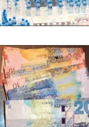
الآسيوي وأمامه زجاجات الخمر