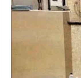
الآسيوي وأمامه زجاجات الخمر