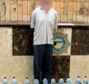
الآسيوي وأمامه زجاجات الخمر