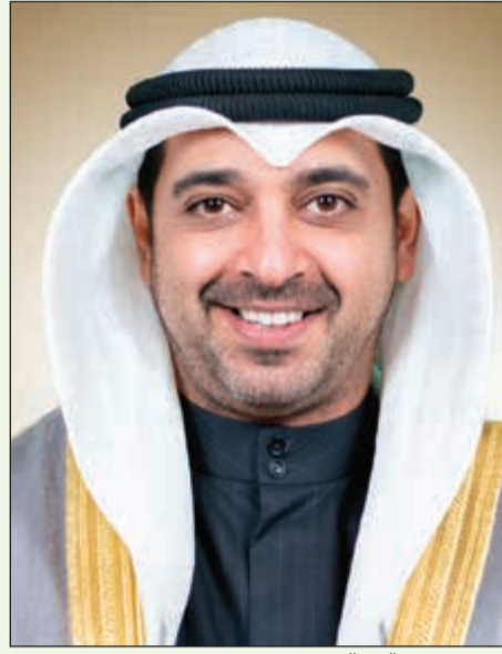
الشيخ محمد العبدالله

وفي ختام حديثه، دعا السلطان المكاتب الهندسية والدور الاستشارية والكويتية والشركات المتخصصة في مشاريع الاستشارات الإدارية والاقتصادية والمالية والبيئية للمشاركة بفعالية بالملتقى في دورته الأولى وحضور جلساته والمعرض المصاحب له، ونوه بأن خطة التنمية الوطنية 2035 للكويت سوف تحتل حيزاً أساسياً من أعمال الملتقى وسيتم خلاله إطلاع المؤسسات والشركات المعنية على الفرص الاستشارية وفرص تطوير الأعمال التي توفرها لهم الخطة، ودعا الراغبين في المشاركة والحضور إلى الاتصال مع شركة NoufEXPO على الرقم 96522469921 أو على البريد الإلكتروني info@noufexpo.com.kw أو زيارة الموقع الإلكتروني الخاص بالملتقى على www.noufexpo.com.kw/encon1 أو الاتصال بالحدود المكاتب الهندسية والدور الاستشارية الكويتية على هاتف: 965 22420482 داخلي 302 أو زيارة الموقع الإلكتروني www.oiace.org.