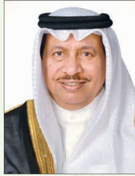
سمو رئيس مجلس الوزراء الشيخ جابر المبارك

وأضاف السلطان: «لقد تعمدنا التركيز على قيم الاحترافية والشفافية في الخدمات الاستشارية خلال الملتقى لإيماننا العميق بأن التمسك بتلك القيم ضرورة ملحة للنجاح سواء في مشاريع خطة التنمية أو في أي مشاريع أخرى بل وفي أي عمل نقوم به، وتلك القيم ليست ضرورة أخلاقية مجتمعية فحسب، ولكنها تمثل في نهاية المطاف العامل الأساسي والحاسم للنجاح، وخطة التنمية الوطنية 2035 انطلقت من هدف