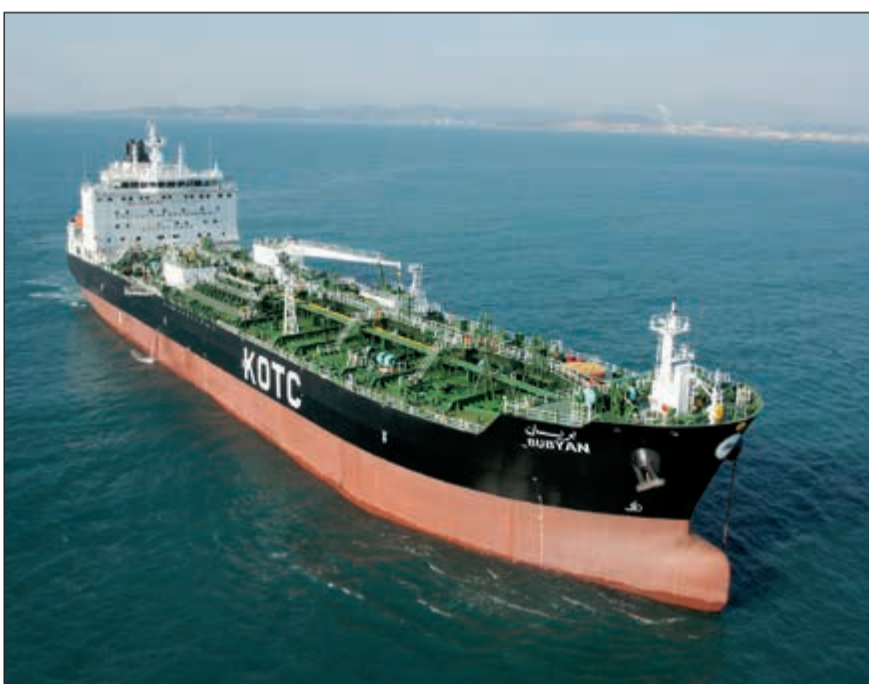
تحسن أسعار النفط يدفع الكويت إلى رفع سعر الشحنات المتجهة إلى آسيا

سيتم تسعيره على أساس العقود الآجلة في بورصة دبي للطاقة في أغسطس. ويعرض ذلك المشتريين لمخاطر، إذ لن يتم إخطارهم إلا بحلول منتصف سبتمبر بما إذا كان قد تم قبول عروضهم لشراء الشحنات، مما يجعل من الصعب عليهم التحوط مسبقاً من تغيرات الأسعار. وارتفعت أسعار النفط الخام وسجل النفط الكوييتي أعلى مستوى في عام ليقترب من مستوى 52 دولاراً للبرميل، واتجه خسارة شهرية في أكثر من عام بسبب مخاوف تتعلق بالطلب، بعد أن تسببت السيول الناتجة عن إعصار هارفي في تعطيل نحو ربع الطاقة التكريرية في الولايات المتحدة.