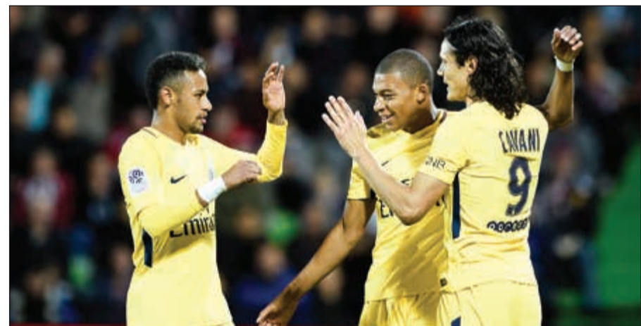
ثلاثي الرعب الجديد في أوروبا

وفرض المهاجم الإيطالي المشاكس ماريو بالتيلي نفسه نجما للمباراة بتسجيله هدفين أحدهما من ركلة جزاء