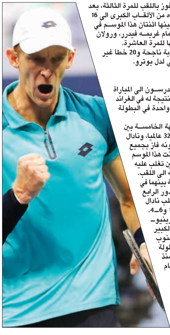
أندرسون يقف بين نادال ولقبه الثالث في «فلاشينغ ميدوز»

يقف الجنوب افريقي كيفن أندرسون بين الإسباني رافيل نادال المصنف أول ولقبه الثالث في بطولة الولايات المتحدة المفتوحة في التنس، آخر البطولات الأربع الكبرى، بعد تأهلها أول من أمس إلى المباراة النهائية. وفي الدور نصف النهائي على ملاعب فلاشينغ ميدوز في نيويورك، تغلب نادال على الأرجنتيني خوان مارتن دل بوترو الرابع والعشرين 6-4 و6-0 و6-2، فيما تخلى أندرسون عقب الإسباني بابلو كارينيو-بوستا الثاني عشر بالفوز عليه بأربع مجموعات أيضا 6-4 و7-5 و6-3. ونأز الإسباني من منافسه الأرجنتيني المصنف 28 عالميا لأن الأخير فاز عليه في المواجهتين الأخيرتين بينهما، حيث أخرج من نصف نهائي أولمبياد ريو الصيف الماضي، ومن الدور ذاته من بطولة الماسترز لعام 2013 في شنغهاي. ورفع نادال عدد انتصاراته على دل بوترو (28 عاما) الذي أخرج السويسري روجيه فيدرر من الدور السابق، إلى 9 من أصل 14 مواجهة بينهما وحرمه من مواصلة حلمه بإحراز لقب البطولة للمرة الثانية بعد عام 2009 حين توج بلقبه الكبير الأول والأخير (فاز حينها في نصف النهائي على نادال بالذات). ثم عانى بعدها من الإصابات وبقيت أفضل نتيجة له في الفراند سلام منذ وصوله إلى نصف نهائي ويمبلدون عام 2013.