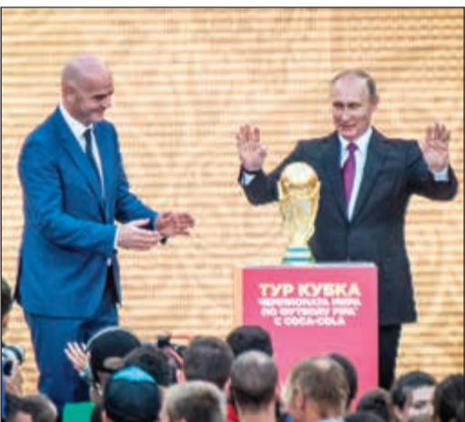
الرئيس الروسي فلاديمير بوتين ورئيس الاتحاد الدولي لكرة القدم السويسري جاني إنفانتينو

أكد الرئيس الروسي فلاديمير بوتين أمس لرئيس الاتحاد الدولي لكرة القدم السويسري جاني إنفانتينو، تقدم استعدادات استضافة مونديال 2018 في الوقت المناسب، وذلك خلال مراسم انطلاق جولة الكأس في جميع أنحاء العالم قبل انطلاق النهائيات. وقال بوتين لإنفانتينو على هامش الحدث في ملعب لوجنيكي الشهير في العاصمة والذي سيستضيف مباريات الافتتاح والختام «سنسندل قصارى جهدنا لاتمام كل شيء في الوقت والنوعية المناسبين». وأضاف «أربعة ملاعب أصبحت جاهزة، كل شيء يتقدم بحسب الجدول المقرر، وكل التمويل مضمون». بدورها، قال إنفانتينو انه «راض جدا» عن تقدم الأعمال.