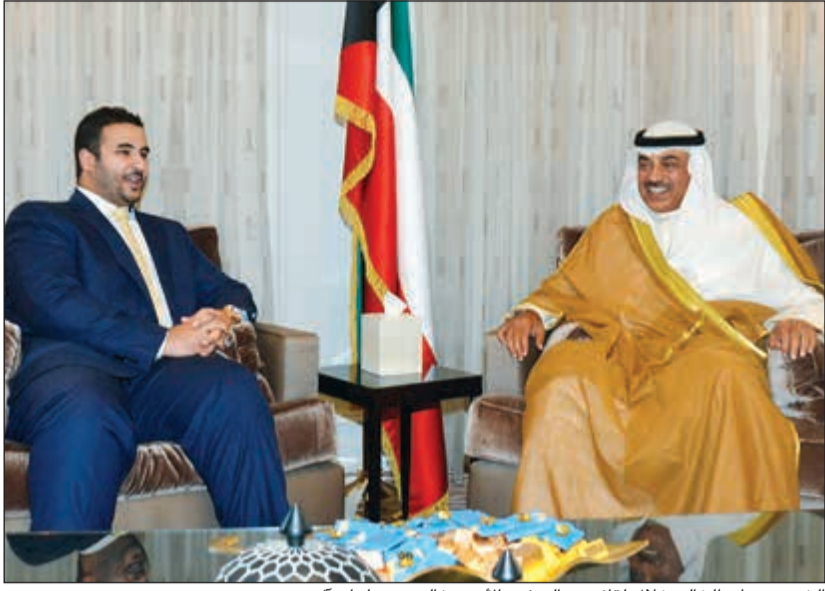
الشيخ صباح الخالد خلال لقائه مع السفير الأميري خالد بن سلمان آل سعود

الاستراتيجي بين الكويت والولايات المتحدة الأميركية. حضر اللقاء كل من نائب وزير الخارجية السفير خالد الجارالله وسفيرنا لدى الولايات المتحدة الأميركية سالم العبدالله ومساعد وزير الخارجية لشؤون مكتب النائب الأول لرئيس مجلس الوزراء ووزير الخارجية السفير الشيخ د. أحمد ناصر المحمد.