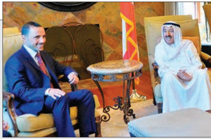
صاحب السمو الأمير الشيخ صباح الأحمد مستقبلاً رئيس مجلس الأمة مرزوق الغانم

صاحب السمو استقبال الغانم في مقر إقامته بالولايات المتحدة.. ونواب يشيدون بحكمة سموه في ذكرى اختياره قائداً إنسانياً 10 و 20