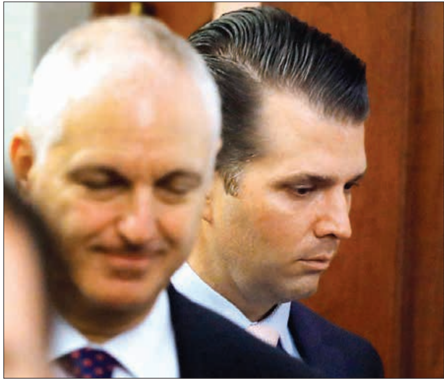
ترامب الابن خلال فترة راحة قبل استئناف شهادته أمام لجنة خاصة في الكونغرس امس الأول

وعلى غرار ما قرره المحكمة العليا في يوليو الماضي، أكد القضاة الثلاثة في سان فرانسيسكو، من جهة أخرى، ضرورة إدراج الأجداد والأحفاد المنحدرين من البلدان المسلمة الستة المستهدفة بمرسوم الهجرة، في صلات القرابي التي يمكن أن تتيح دخول الولايات المتحدة. وأشارت إلى أن إدارة ترامب «لا تقدم تفسيراً مقنناً حول لماذا تعتبر زوجة الأب صلة» قريبة، «فلم لا ينطبق ذلك أيضاً على الجد والحفيد والعم والعمة وابن الأخ أو ابن العم»، وأشار القضاة إلى