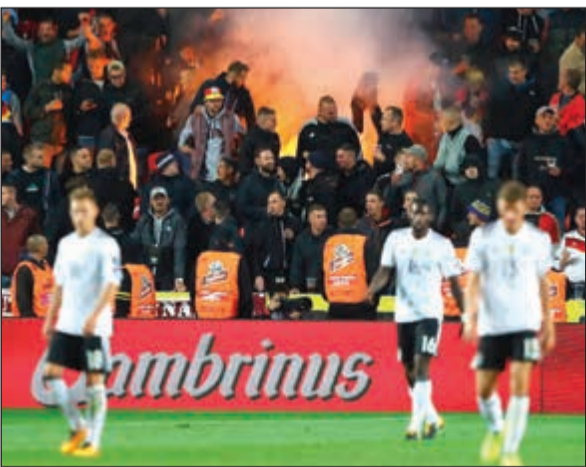
الجماهير الألمانية أطلقت هتافات نازية خلال مباراة منتخبهم أمام التشيك

أعلن الاتحاد الدولي لكرة القدم «فيفا» أنه فتح تحقيقات حول قيام الجماهير الألمانية بإطلاق هتافات نازية خلال مباراة ألمانيا وجمهورية التشيك يوم الجمعة الماضي في التصفيات الأوروبية المؤهلة لبطولة كأس العالم 2018 بروسيا.