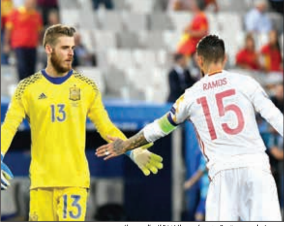
دي خيا يريد تحقيق حلمه بالانتقال إلى ريال مدريد

طلب دافيد دي خيا حارس مرمى مان يونايتد من زميله بالمنتخب الإسباني، سيرجيو راموس، الذي بدوره قائد ومدافع فريق ريال مدريد أن يساعده في تحقيق حلمه والانتضمام للمريضي الصيف المقبل، حسب تأكيدات صحيفة «A Bola» البرتغالية.