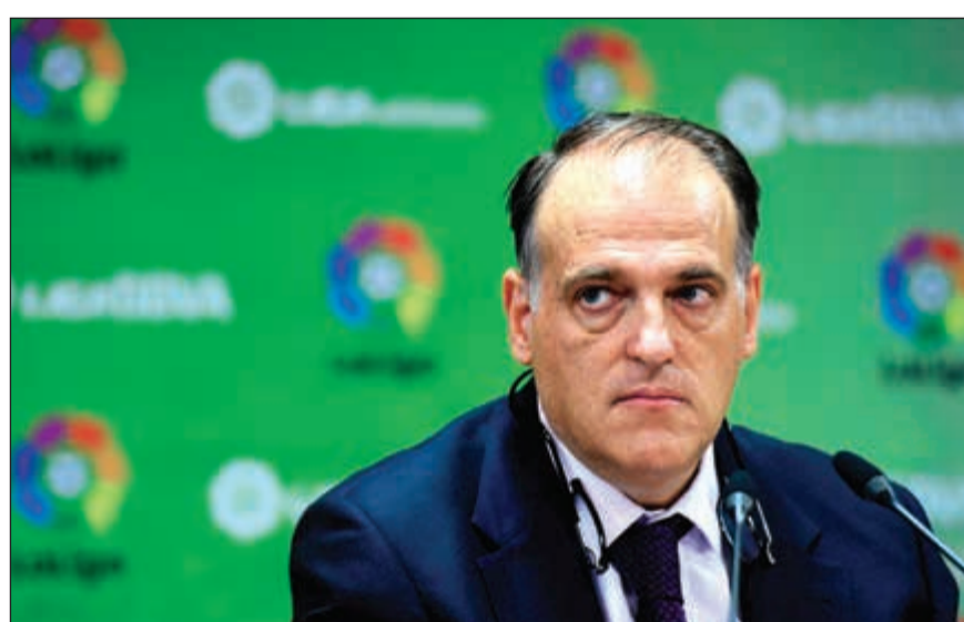
رئيس رابطة الدوري الإسباني لكرة القدم خافيير تيباس

أما سان جرمان، فتعاقد مع البرازيلي نيمار من برشلونة الإسباني مقابل 222 مليون يورو قبل انتهاء عقد اللاعب، منفقا مبلغا قياسيا حرر اللاعب من