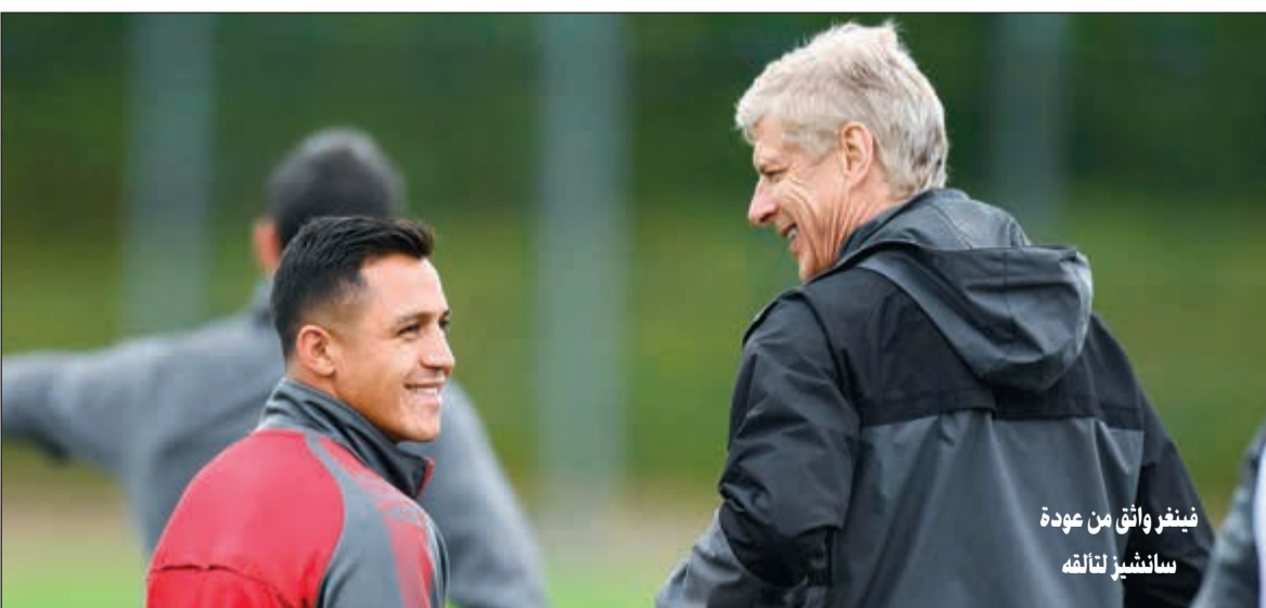
فينغر واثق من عودة سانشيز لتأهله

حان الوقت لتغيير اللوائح وإغلاق سوق الانتقالات قبل بداية الموسم. وختم بالقول: «اللاعبون لا يعرفون ما إذا كانوا سيقفون مع الفريق أم سيرحلون، إنه أمر غير مريح وكل مدرب في الدوري يتفق على أنه حان الوقت لإنهاء فترة الانتقالات قبل بداية الموسم، لا يمكن أن يكون لديك لاعبون في غرفة خلع الملابس بنصفهم فقط بينما النصف الآخر مع فريق آخر».