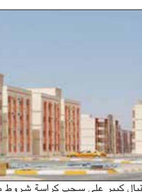
اقبال كبير على سحب كراسة شروط مشروع «سكن مصر»