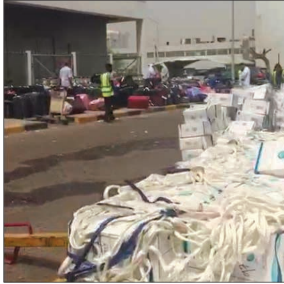
عبوات مياه زمزم على الرصيف

أكد مصدر مسؤول في إدارة الطيران المدني أنه سيتم منح موظفي إدارة الطيران المدني من العاملين في عيد الأضحي ومستقبلي حج بيت الله الحرام مكافآت مالية نظير عملهم قريبا. وأضاف أنه جار حصر أعداد الموظفين العاملين خلال هذه الفترة والمستحقين منهم لمنحهم هذه المكافآت وذلك بالتنسيق بين وزارة المالية وديوان الخدمة المدنية. وكشف المصدر عن أن هذه المكافآت سيتم توزيعها حسب المسمى الوظيفي، موضحا أنها عبارة عن مكافأة تشجيعية للموظفين الذين كانوا على رأس عملهم خلال اجازة عيد الأضحي المبارك وعودة الحج، مؤكدا أنه حال اعتمادها من ديوان الخدمة سيتم اعتمادها وصرفها للمستحقين من الموظفين.