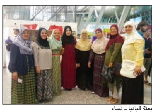
بعثة ألبانيا - نساء

إلحتم أحببتنا في الكويت أنتيمت البنا.. تحملون الفرح بين أيديكم لم يوفكم البعد ولا العناء.. أنتيمت تنثرون بذور العطاء في أرضنا.. لتنتب فلا وباسمينا وقمحا.. وفرشت لكم الأرض... وابتسمت لكم السماء... وتساقط رذاذ الخير والبركة... في أنحاء ألبانيا.. أخذتم بيد أحلام بعض أحمائنا ممن تأقت نفوسهم للحج وزيارة بيت الله الحرام.. فحولتم الحلم إلى حقيقة.. بوركتهم وبورك مسعاهم.. وجراكم الله كل خير، وهنينا لكم رضا الله وبركاته عليكم.