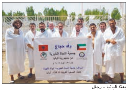
بعثة ألبانيا - رجال