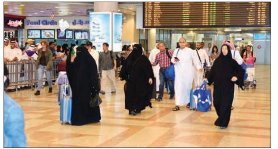
تيسير إجراءات وصول الحجاج