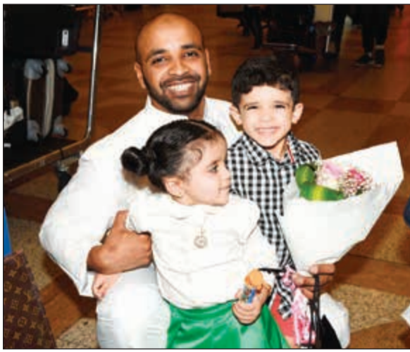
أحد الحجاج يحمل طفليه لحظة وصوله المطار