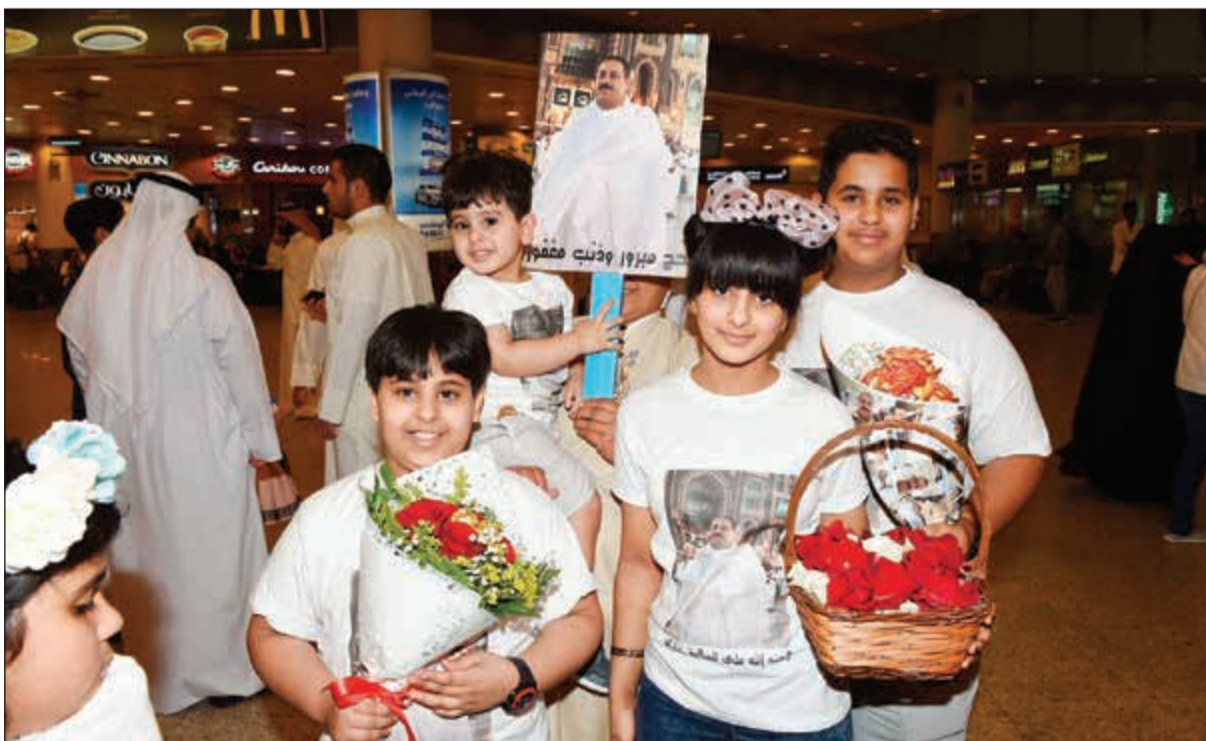
اطفال يحملون الورود في استقبال الحجاج

وأضاف الثويني أن عدد الحجاج الذين استقبلهم مطار الكويت خلال يومي الاثنين والثلاثاء بتاريخ 4 و5 الجاري بلغ 8200 حاج، منهم 2400 حاج استقبلهم