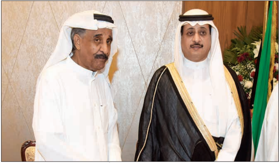
الأمين العام المساعد لقطاع الفنون في المجلس الوطني للثقافة والفنون والآداب د.بدر الدويش والعيدروسى