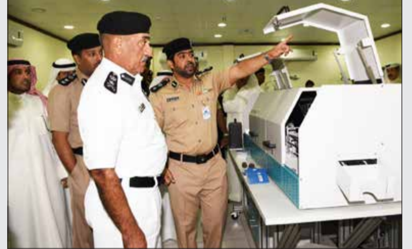
الفريق الشيخ محمد اليوسف يطلع على التقنيات الحديثة الخاصة باستصدار الجواز الإلكتروني