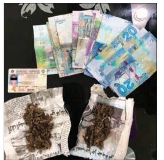
الماريغوانا التي ضبطت بحوزة البنغالي

أقدم سائق تنكر مياه على التوقف وإخماد نيران انبعلت في مركبة صالون على الدائري الرابع، وبحسب مصدر أممي فإن المركبة شبت بها النيران إثر حادث اصطدام بحاجز أسمنتي وحضائف مرور التنكر، والذي استخدم مياه للسيطرة على الحريق، فيما لحقت بسائق المركبة إصابات وصفت بالمتوسطة. كما أمد رجال الإطفاء حريقاً شب في قارب بمنطقة القصور، واقتصرت الخسائر على أضرار مادية وجار معرفة أسباب الحريق.