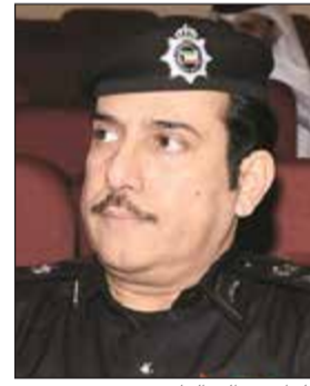
اللواء عبدالله الهاجري

وقال المصدر إن مدير عام الإدارة العامة لشؤون الإقامة بالإنابة اللواء عبدالله الهاجري أبلغ الجهات المعنية بانتظار تعليمات بهذا الخصوص في غضون الأيام القليلة المقبلة. وأشار المصدر إلى أن موافقة