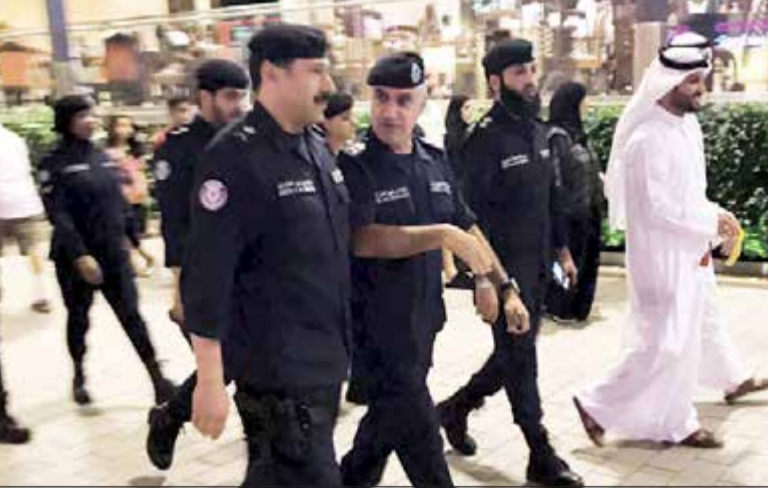
وكيل وزارة الداخلية لشؤون الأمن العام بالإنابة اللواء ابراهيم الطراح وبرفقه اللواء عابدين العابدين

العالي والتعامل الحضاري مع الجمهور. من جهة أخرى، وفي ترجمة لتعليمات نائب رئيس مجلس الوزراء وزير الداخلية الشيخ خالد الجراح بضرورة الانتشار المنظم بين المتسوقين في عطلة عيد الأضحى وداخل وفي محيط الأماكن الترفيهية قام وكيل وزارة الأمن والمساعد لشؤون الأمن العام اللواء ابراهيم الطراح بالتحول في عدة أسواق ومتنزهات طيلة أيام عيد الأضحى المبارك، وبحسب مصدر أممي فإن وكيل وزارة الداخلية المساعد قام بهذه الجولات بشكل مفاجئ للاطلاع على انتشار قوة الأمن العام في الأسواق ووجه اللواء الطراح تعليماته بضرورة الانتشار المكثف لبث الأمن والأمان في نفوس المواطنين والمقيمين.