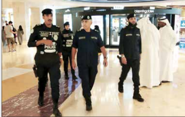
اللواء ابراهيم الطراح في إحدى جولاته المفاجئة