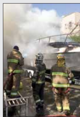
إخماد حريق قارب القصور

أقدم سائق تنكر مياه على التوقف وإخماد نيران انبعلت في مركبة صالون على الدائري الرابع، وبحسب مصدر أممي فإن المركبة شبت بها النيران إثر حادث اصطدام بحاجز أسمنتي وحضائف مرور التنكر، والذي استخدم مياه للسيطرة على الحريق، فيما لحقت بسائق المركبة إصابات وصفت بالمتوسطة. كما أمد رجال الإطفاء حريقاً شب في قارب بمنطقة القصور، واقتصرت الخسائر على أضرار مادية وجار معرفة أسباب الحريق.