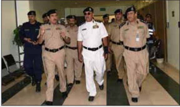
الفريق الشيخ محمد اليوسف خلال زيارته للإدارة العامة لشؤون الإقامة

العالي والتعامل الحضاري مع الجمهور. من جهة أخرى، وفي ترجمة لتعليمات نائب رئيس مجلس الوزراء وزير الداخلية الشيخ خالد الجراح بضرورة الانتشار المنظم بين المتسوقين في عطلة عيد الأضحى وداخل وفي محيط الأماكن الترفيهية قام وكيل وزارة الأمن والمساعد لشؤون الأمن العام اللواء ابراهيم الطراح بالتحول في عدة أسواق ومتنزهات طيلة أيام عيد الأضحى المبارك، وبحسب مصدر أممي فإن وكيل وزارة الداخلية المساعد قام بهذه الجولات بشكل مفاجئ للاطلاع على انتشار قوة الأمن العام في الأسواق ووجه اللواء الطراح تعليماته بضرورة الانتشار المكثف لبث الأمن والأمان في نفوس المواطنين والمقيمين.