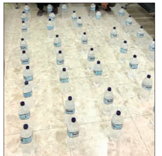
قناني الخمر التي ضبطت في خيطان

تمكنت إحدى دوريات أمن الفروانية من ضبط وافر بنغالي عثر بحوزته على مواد يشتبه في أنها مخدرة «ماريغوانا»، وكانت إحدى الدوريات في جولة اعتيادية لها عندما اشتبهت في وافر تبين لاحقاً أنه بنغالي من مواليد 1994 وذلك بعد أن ظهرت عليه علامات الارتباك فور مشاهدته الدورية ومحاولته الفرار، فتمت مطاردته جرياً وضبطه، وبتفتيشه عثر بحوزته على ماريغوانا وتمت إحالته إلى الإدارة العامة لمكافحة المخدرات. من جهة أخرى، ألقى القبض على شخصين من الجنسية الهندية وعثر بحوزتهما على 38 قنينة بها خمور محلية الصنع.