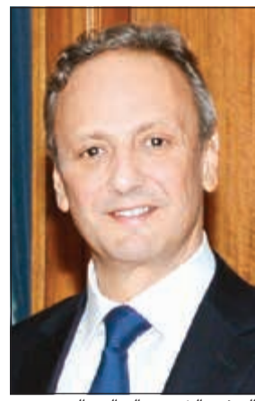
السفير الشيخ سالم العبدالله

العبد الله: زيارة الأمير لواشنطن بداية لمرحلة جديدة في العلاقات الثنائية تنتقل إلى الـ 25 سنة القادمة من العلاقات بين البلدين ووضع أسس جديدة لدفعها إلى مراحل متقدمة بجفظ الله ورعايته، يتوجه صاحب السمو الأمير الشيخ صباح الأحمد والوفد الرسمي المرافق لسموه اليوم إلى العاصمة واشنطن وذلك في زيارة رسمية يجري سموه خلالها مباحثات رسمية مع الرئيس دونالد ترامب رئيس الولايات المتحدة الأميركية الصديقة. رافقت سموه السلامة في الحل والترحال. في هذا السياق، قال نائب وزير الخارجية خالد الجارالله ان زيارة صاحب السمو الأمير الشيخ صباح الأحمد إلى الولايات المتحدة أعلى مستوى بين البلدين للتحديث حول العلاقات الثنائية والقضايا الإقليمية ذات الاهتمام المشترك. واضاف الجارالله في تصريحه هاتفي لقناة «المجلس» ان الكويت والولايات المتحدة الأميركية تجمعها شراكة استراتيجية وعلاقة ذات مصالح كبيرة معرباً عن الأمل بان تصطبغ هذه الزيارة إلى العلاقات المتميزة بين البلدين الشيء الكثير. وأوضح انه سيتم خلال هذه الزيارة بحث سبل تعزيز التعاون في مختلف المجالات السياسية