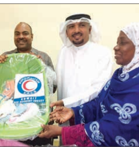
جانب من تبرع الهلال الأحمر