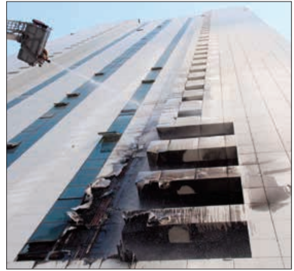
مكافحة النيران بالسalam الالية