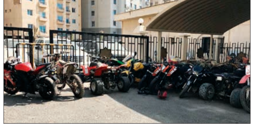
الدراجات النارية التي سرقتها التشكيل واستخدمها في سلب وافدين