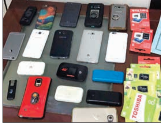
من المسروقات التي عثر عليها بحوزة اللصوص

صحي يقع بمنطقة الرقيعي، وتم ضبط بعض المسروقات وكانت عبارة مجموعة هواتف نقالة وهي حصيلة عمليات السرقات التي قاموا بها ويصل عددها إلى 13 هاتفًا نقالا، وكذلك الاداة المستخدمة بعمليات الكسر، حيث اعترف التشكيل باستهداف عدة مركبات. وعثر مكتب مباحث مخفر شرطة السالمية بحوزتهم على 7 دراجات نارية مسروقة كانوا يقومون بسرقتها باستخدام مفك يدوي لتسهيل عملية التشغيل بطريقة