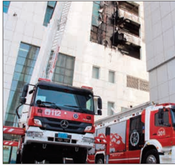
عربات الإطفاء هرعت إلى موقع الحريق خلال 4 دقائق