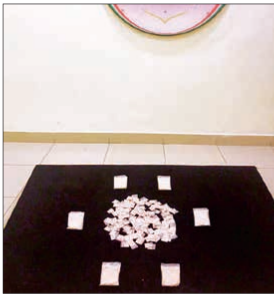
الهيروين الذي ضبط مع الأسويي

تمكنت ادارة المكافحة المحلية من ضبط شخص أسويي الجنسية بمنطقة الفروانية وبحوزته نصف كيلو من مادة الهيروين المخدرة. وكانت معلومات قد وردت إلى الإدارة العامة لمكافحة المخدرات بأن المتهم بحوزته كمية من مادة الهيروين المخدرة بقصد الاتجار، وبناء على تلك المعلومات تم تكثيف التحريات، وبعد التأكد من صحتها تم اتخاذ الإجراء القانوني اللازم ومداومة المتهم وضبطه وعثر بحوزته على نصف كيلو من مادة الهيروين المخدرة، وبمواجهته اعترف بحيازته المضبوطات بقصد الاتجار وتمت إحالة المتهم والمضبوطات إلى جهة الاختصاص.