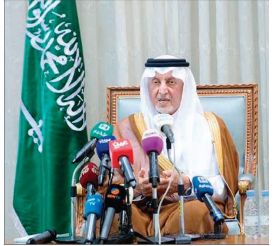
مستشار خادم الحرمين الشريفين أمير منطقة مكة المكرمة رئيس لجنة الحج المركزية صاحب السمو الملكي الأمير خالد الفيصل