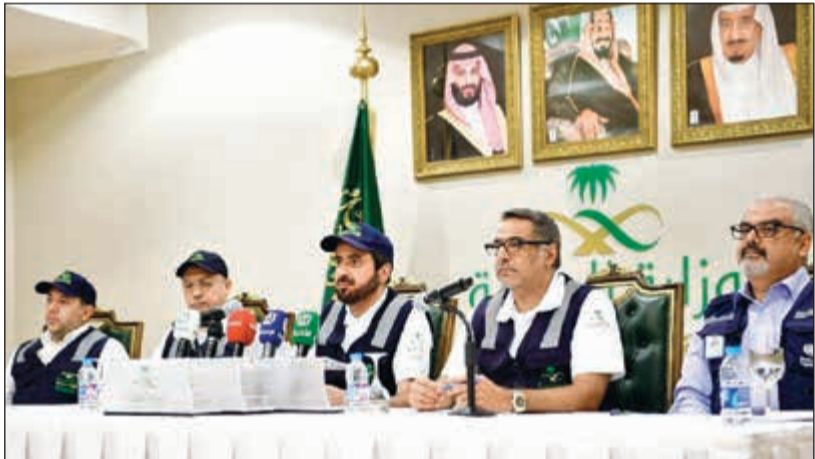
جانب من المؤتمر الصحافي لوزير الصحة

المنامة - كونا: هنا مجلس الشورى البحريني أمس المملكة العربية السعودية بمناسبة نجاح موسم الحج لهذا العام، مشيدا بالجهود التي بذلتها جميع الجهات والمؤسسات من أجل حماية الحجاج وتقديم جميع سبل الرعاية والاهتمام لهم. وأشاد مجلس الشورى في بيان صحافي نقلته وكالة الانباء البحرينية (بنا) بالمتابعة المباشرة من قبل خادم الحرمين الشريفين للحجاج الذين توافدوا لأداء مناسك الحج من مختلف الدول. وأعرب عن شكره وتقديره لجميع الجهات والمؤسسات خاصة رجال الأمن والقوات المسلحة لما قاموا به من جهود لحماية الحجاج وتقديم جميع سبل الرعاية والاهتمام لهم.