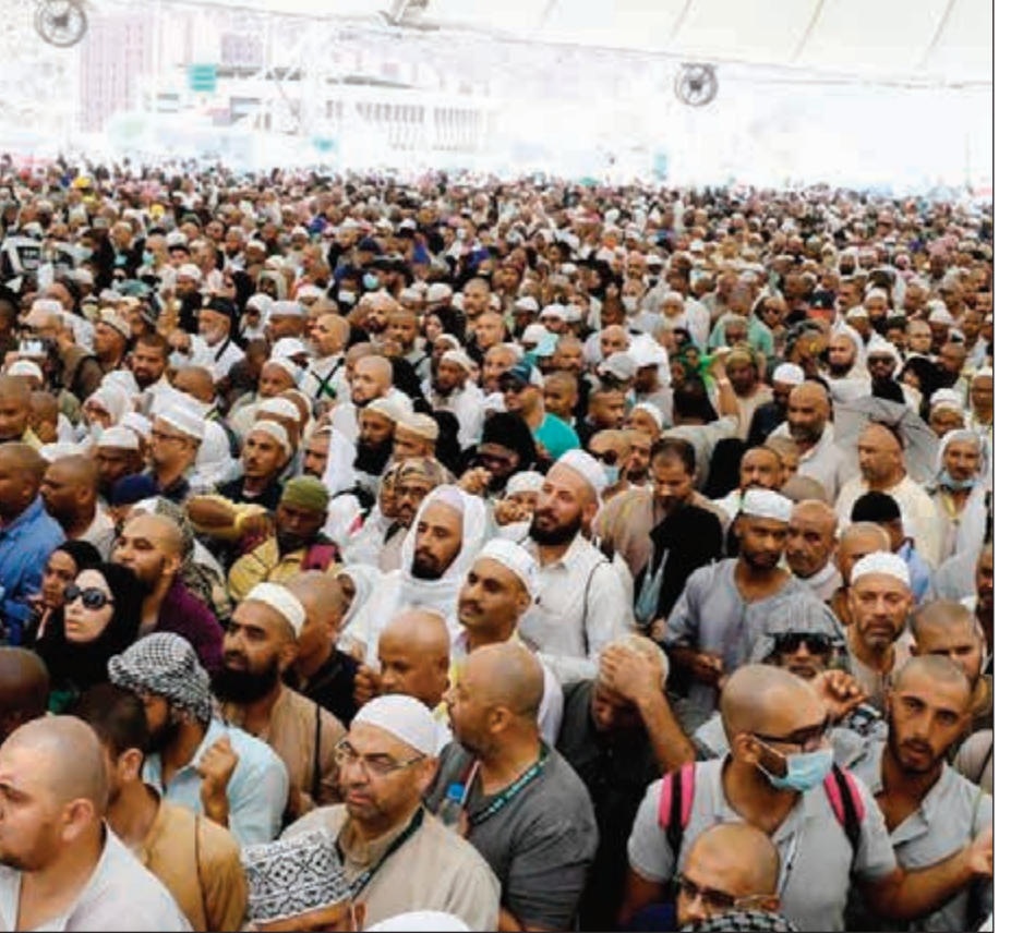
حجاج بيت الله الحرام واصلوا رمي الجمرات أمس (واس)

الرياض - العربية.نت: وصف اللاعب السنغالي دمبابا المحترف في صفوف نادي شانغهاي الصيني، والمولود في فرنسا، رحلة الحج بالتجربة التي تجرد منها عن كل ما يفرق بينه وبين الآخرين، مشيراً إلى أن أداء هذه الفريضة على الوجه الأكمل يضمن للمسلم مكاسب دنيوية. اللاعب الذي خاض تجربة رياضية حافلة في الكرة الأوروبية وتميز فيها لم يجد حرجاً في الاعتراف بجبهه بترتيب النسك، إلا أنه كان يحفظ تلك النسك ومسمياتها وصفات أدائها، مؤكداً أنه بات اليوم على دراية كاملة بالنسك من بدايتها حتى نهايتها. يذكر أن دمبابا أدى العمرة 5 مرات، كانت الأولى عام 2011، وشعر في مكة المكرمة التي عاش في رحابها أوقاتاً بالسكينة والهدوء، ما جذبته للعودة خمس مرات ليعيش التجربة بنفسها. وعما رآه في المشاعر المقدسة وما شعر به خلال أدائه مناسك الحج قال: «سبق أن رأيت منى وعرفة ومزلفة في غير موسم