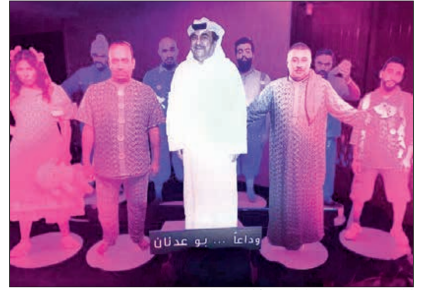
البلام وفريق عمل «مبروك ما ياكم» برفقة الراحل عبدالحسين عبدالرضا