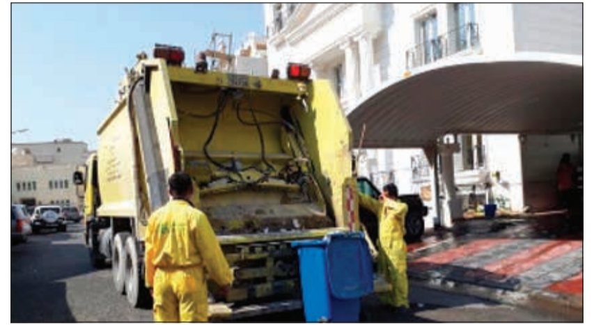
عمال البلدية خلال حملة النظافة

طناً من الانقاض المهجولة ومخلفات الأشجار والمزروعات، بالإضافة إلى كسب وتنظيف 33 شارعاً فرعياً و45 شارعاً رئيسياً، إلى جانب رفع 14 سيارة مهملّة ووضع 19 ملصقاً للسيارات المهملّة والمعروضة للبيع، كما تم غسل وتبديل 86 حاوية، وتنظيف 9 ساحات مدارس، ورفع 25 إعلاناً مخالفاً، إلى جانب رفع 5 اطنان من مخلفات مسلخ سلوى، وضبط 8 عمال متسولين.