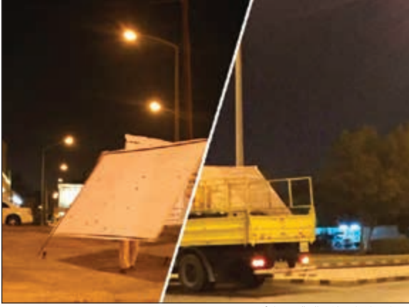
رفع الاعلانات المخالفة في الأحمدية

كشفت إدارة العلاقات العامة في البلدية عن قيام فريق الطوارئ التابع لفرع بلدية محافظة الأحمدية بجولة تفقدية في شوارع وميادين المحافظة بهدف إزالة الإعلانات العشوائية بالمحافظة. وقد أسفرت الجولة عن رفع 87 إعلاناً عشوائية تنوع ما بين الورقي والحديد والكرتوني. كما قام فريق الطوارئ التابع لفرع بلدية محافظة الأحمدية بجولة تفتيشية على المطاعم والأسواق الغذائية بالمحافظة. وأسفرت الجولة عن تحرير 13 محضر مخالفة تنوعت ما بين عدم التقيد باشتراطات النظافة العامة وعدم تجديد ترخيص الإعلان.