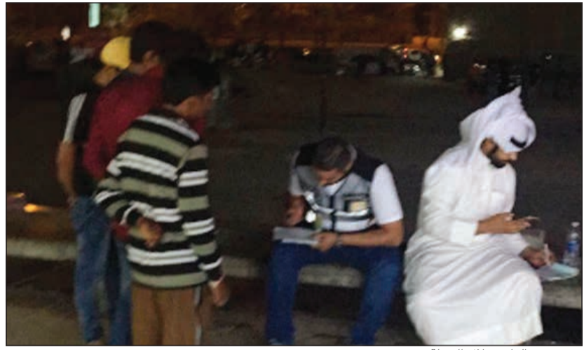
تحرير مخالفات خلال الجولة