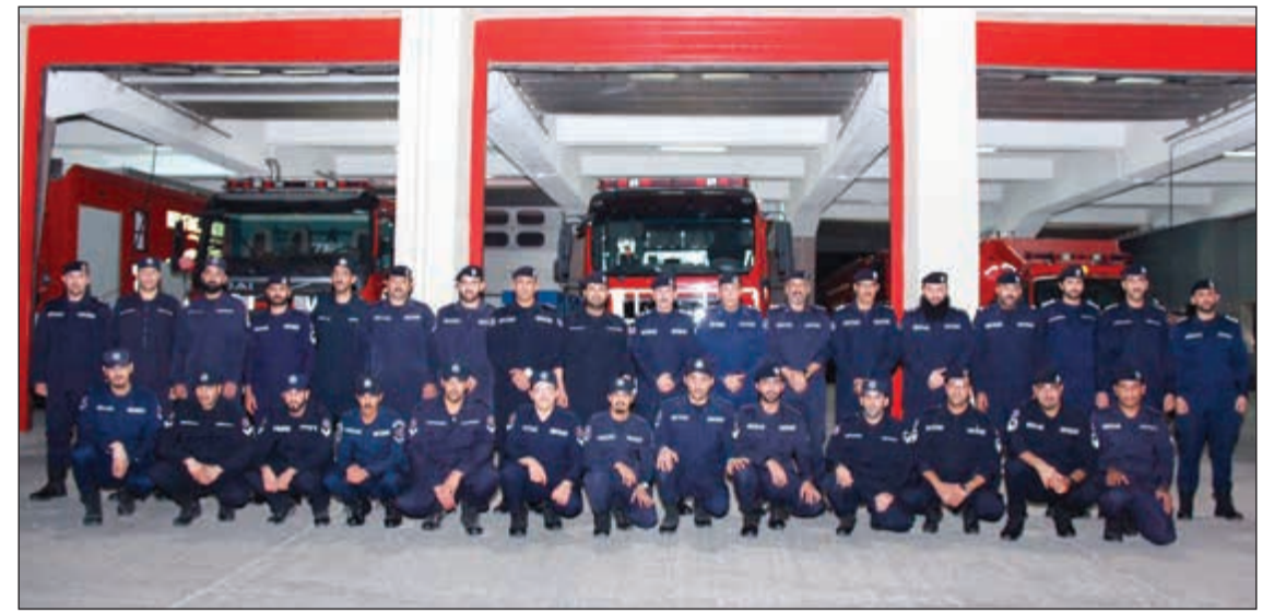
الفريق خالد المكراد خلال زيارته إلى أحد مراكز الإطفاء