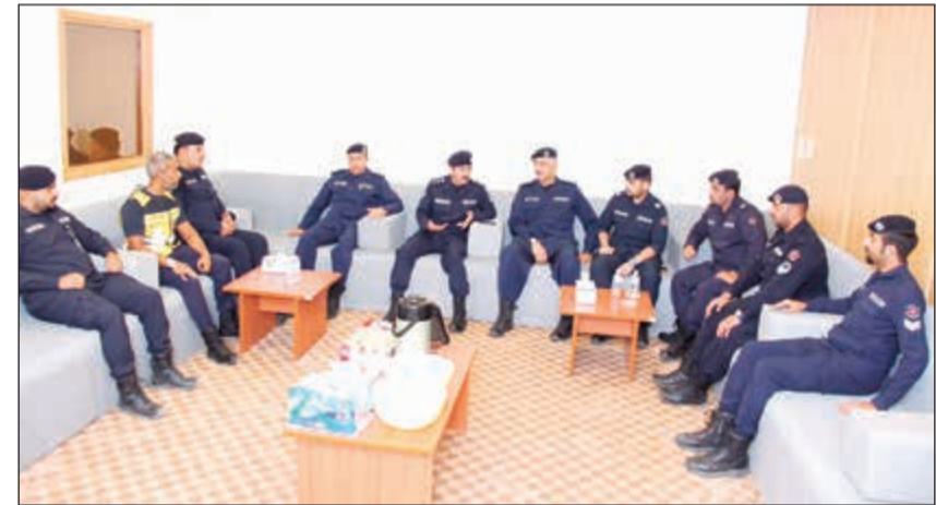
جانب من لقاء المكراد مع بعض رجال الإطفاء

جاء ذلك وفق بيان صحفي للإطفاء خلال جولة الفريق المكراد مراكز الإطفاء في أول أيام عيد الأضحى المبارك بتوجيهات من وزير الدولة لشؤون مجلس الوزراء ووزير الإعلام بالوكالة الشيخ محمد العبدالله حيث نقل إليهم تهنئة وتحيات وتقدير القيادة السياسية على عملهم البطولي والشجاع في تأمين الأرواح والممتلكات. وأعرب المكراد عن ارتياحه وثقته في رجال الإطفاء البواسل على تعاونهم مع قياداتهم في أحلك الظروف مما يعكس على الأداء المميز الذي تلخص في التعامل مع مختلف الحوادث وخصوصاً الكبيرة بكل كفاءة واقتدار.