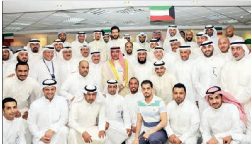
وكيل وزارة الداخلية الفريق محمود محمد الدوسري خلال زيارته مقر بعثة الحج الكويتية في مكة المكرمة

قام وكيل وزارة الداخلية الفريق محمود محمد الدوسري بزيارة مقر بعثة الحج الكويتية في مكة المكرمة، حيث التقى مسؤولي البعثة وتداول معهم شؤون الحجاج لهذا العام. كما التقى بعثة الحج من منتسبي وزارة الداخلية والتي تضم ضباطا وضباط صف ومدنيين من كل قطاعات الوزارة المتواجدين في الأراضي المقدسة لأداء فريضة الحج، حيث نقل لإخوانه رجال الأمن تحيات نائب رئيس مجلس الوزراء وزير الداخلية الشيخ خالد الجراح واعتزازه بهم وبإخلاصهم، متمنيا لهم حجا مبرورا وسعيا