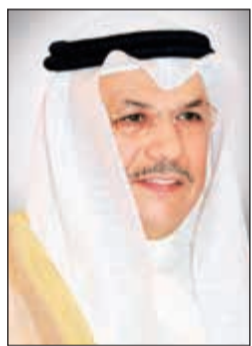
وزير الداخلية الشيخ خالد الجراح

هنا نائب رئيس مجلس الوزراء وزير الداخلية الشيخ خالد الجراح، صاحب السمو الملكي وزير الداخلية بالمملكة العربية السعودية الشقيقة الأمير عبدالعزيز بن سعود بن نايف بن عبدالعزيز آل سعود بنجاح موسم الحج لهذا العام وبعث إليه ببرقية هذا نصها: يطيب لي أن أبعث لسموكم أسامي آيات التهاني والتبريكات على نجاح موسم الحج لهذا العام