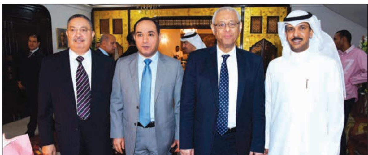
السفير ياسر عاطف مع الملحق العسكري المصري والعقيد يوسف الرشيد من الجيش الكويتي

الديبلوماسية والاجتماعية في الكويت تتسم بكونها حياة غنية وثرية، وهذه ميزة كبيرة حيث بلا مبالغة أستطيع أن أقول إن كم المناسبات والأنشطة التي شاركت فيها تعد من أكثر الأنشطة في أي بلد آخر، فالخدمة في بلد عربي مثل الكويت له رونق خاص لما لهذه العلاقات الاجتماعية من أثر إيجابي واضح. رسالة للمصريين في الكويت كما وجه السفير ياسر عاطف رسالة خاصة إلى أبناء مصر في الكويت قائلا: أشرككم على كل ما قدمتموه لبلدكم وأدعوكم أن تبقى مصر دائما نصب أعينكم في كل عمل تقومون به. كما تطرق إلى أهم الإنجازات التي حققتها سفارة بلاده خلال فترة توليه عمله قائلا إنها كثيرة وهي امتداد لعمل مؤسسي قائم ومستمر بلا شك، مشيرا إلى أن الترتيب لزيارة الرئيس المصري