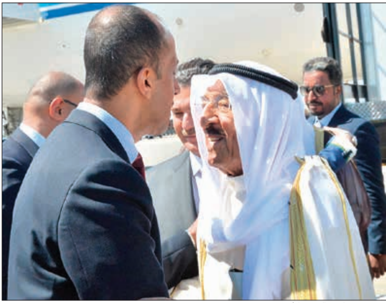
ترحيب بصاحب السمو الأمير