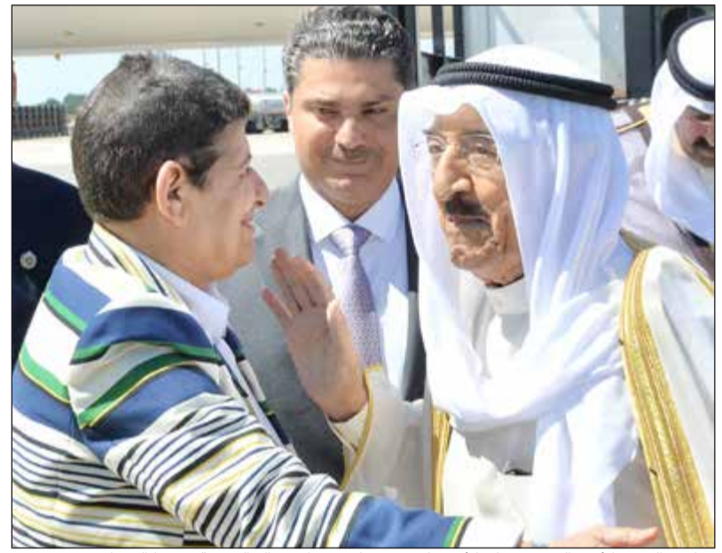
صاحب السمو الأمير الشيخ صباح الأحمد لدى وصوله وفي استقباله الشيخة درشا الصباح