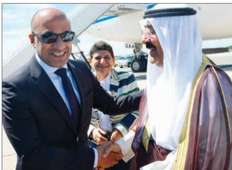
ترحيب بالشيخ مشعل الأحمد