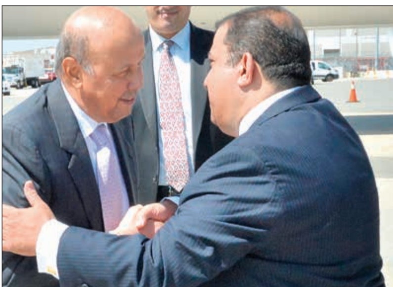
السفير أحمد فهد الفهد مصافحا أحد الحضور في المطار

واشنطن - كونا: يحفظ الله وراعيته وصل صاحب السمو الأمير الشيخ صباح الأحمد يرافقه نائب رئيس الحرس الوطني الشيخ مشعل الأحمد والوفد الرسمي المرافق لسموه ظهر أمس إلى الولايات المتحدة الأمريكية الصديقة، وذلك في زيارة رسمية يجري سموه خلالها مباحثات رسمية مع الرئيس دونالد ترامب رئيس الولايات المتحدة الأمريكية الصديقة وذلك في يوم الخميس الموافق 7 سبتمبر 2017 ميلادية بالعاصمة واشنطن. وكان في استقبال سموه على أرض المطار المستشار بيدوان سمو رئيس مجلس الوزراء الشيخة درشا الصباح وسفيرنا لدى الولايات المتحدة الأمريكية الشيخ سالم العبدالله ومنذوبنا الدائم لدى الأمم المتحدة السفير منصور العنبي والقنصل العام في مدينة لوس انجليس فيصل ابراهيم الهولي وأعضاء مندوبية. رافقت سموه السلامة في الحل والترحال. إلى ذلك بعث صاحب السمو الأمير صباح الأحمد ببرقية تهنئة إلى الرئيس تران داي كونغ رئيس جمهورية فيتنام الاشتراكية الصديقة عبر فيها سموه عن خالص تهنئته بمناسبة العيد الوطني لبلاده، متمنيا له موفق الصحة والعافية وللبلد الصديق دوام التقدم والازدهار. وبعث سمو نائب الأمير وولي العهد الشيخ نواف الأحمد ببرقية تهنئة إلى الرئيس تران داي كونغ رئيس جمهورية فيتنام الاشتراكية الصديقة ضمنها سموه خالص تهنئته بمناسبة العيد الوطني لبلاده راجيا له موفق الصحة والعافية. كما بعث سمو رئيس مجلس الوزراء الشيخ جابر المبارك ببرقية تهنئة مماثلة.