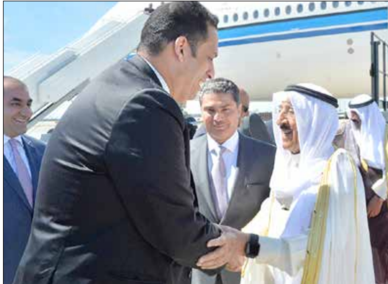
صاحب السمو مصافحا أحد مستقبليه في المطار