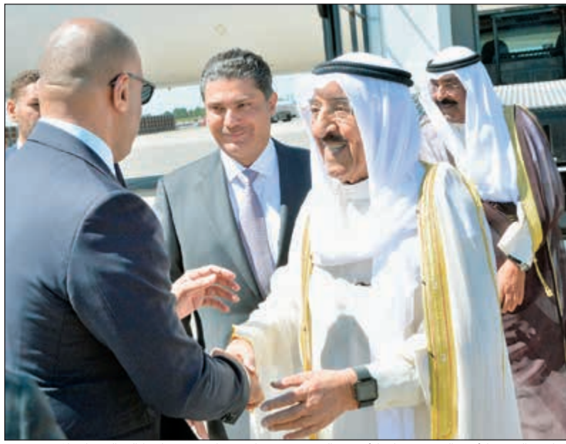
صاحب السمو الأمير الشيخ صباح الأحمد والشيخ مشعل الأحمد لدى وصولهما إلى الولايات المتحدة