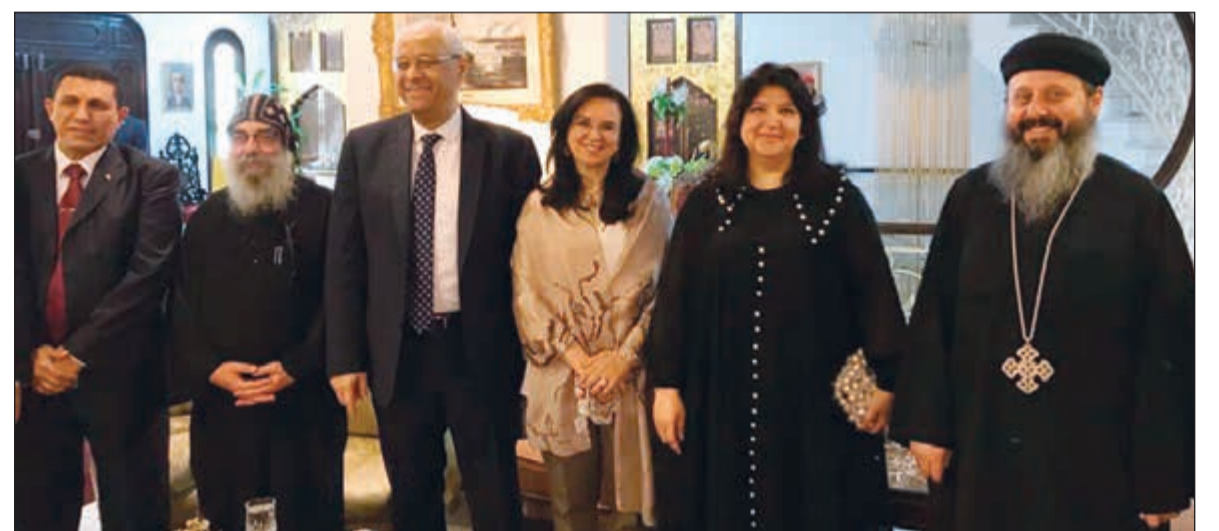
القاص بجول الانبا بيشوي وجماعة التقى بهنثان السفير المصري ياسر عاطف ورحمه

وجهد الشيخة الطاف سالم العلي حيث تم تقديم عروض جديدة حول الفنون المصرية غير التقليدية التي لا يعرفها الكثيرون. دعوة للسياحة والاستثمار وفي رده على سؤال «الأنباء» حول السياحة في مصر والرسالة التي يوجهها للسائح الكويتي أكد عاطف أنه لاحظ تزايدا واضحا في أعداد الكويتيين الزائرين لمصر خلال هذه الفترة، خاصة في شرم الشيخ، بما يشير لتقدم جديد في هذا الجانب، مضافا أن مصر تشهد تقدما كبيرا في السياحة والاستثمار أيضا، مشيرا إلى أن ما تم تحقيقه لتأمين هذه القطاعات وجعلها عنصر جذب يستحق الإشادة، وداعيا الجميع لزيارة مصر والاستفادة من الفرص الاستثمارية فيها والاستمتاع بكل ما تحويه من كنوز سياحية يعرفها الجميع، مؤكدا أن السياحة في مصر بدأت تستعيد رونقها وتآلقها.