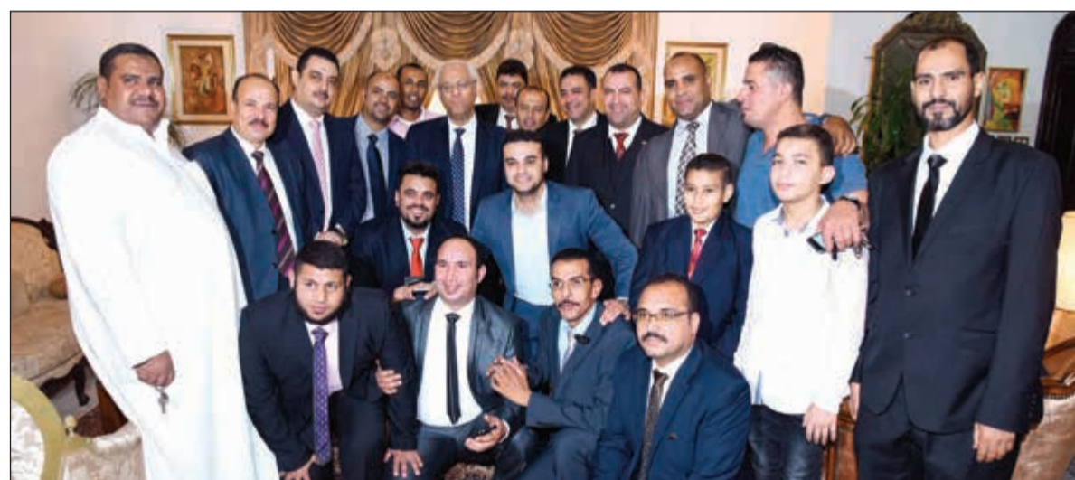
السفير ياسر عاطف مع عدد من أبناء الجالية المصرية في الكويت (احمد على)