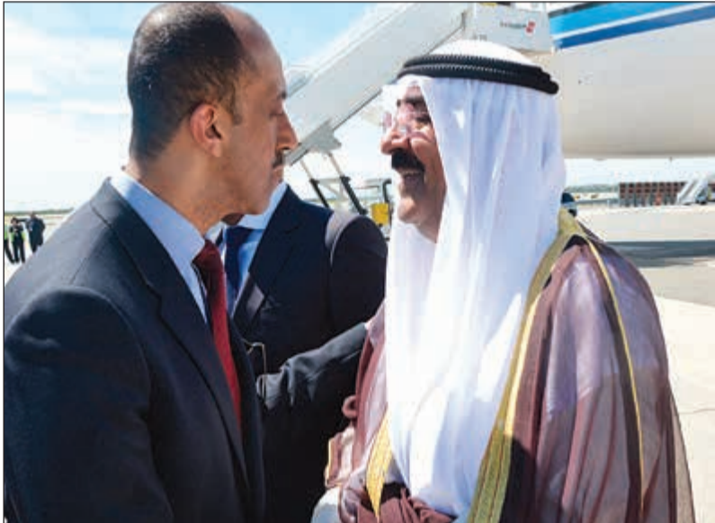
الشيخ مشعل الأحمد مصافحا أحد الحضور في المطار