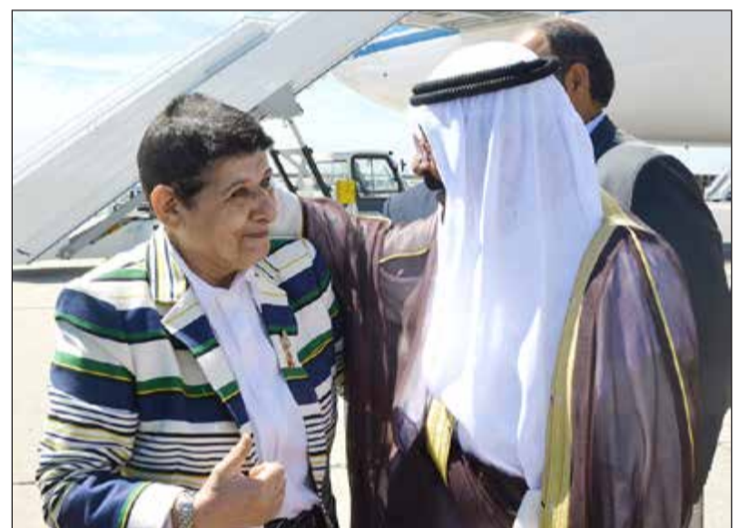
حديث بين الشيخ مشعل الأحمد والشيخة درشا الصباح